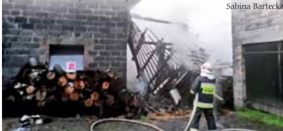
Właściciele ponieśli ogromne straty.