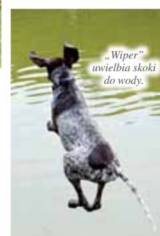
„Wiper” uwielbia skoki do wody.

Takich czworonogów nie spotykamy na codziennym spacerze. To fachowcy w swojej dziedzinie. Do Pielgrzymowic zjechały psy myśliwskie, aby sprawdzić się w czasie pracy w wodzie i w terenie.