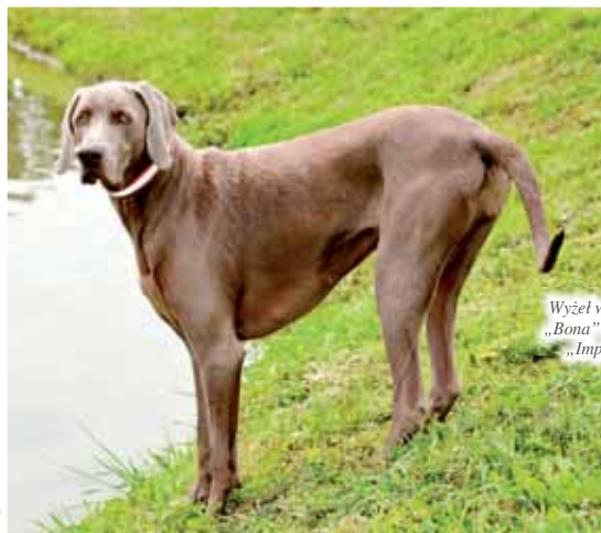
Wyżł weimarski „Bona” z hodowli „Imperial”.