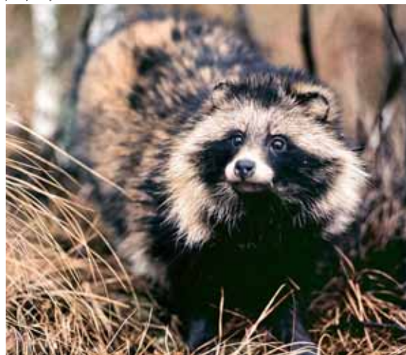
Jenoty sieją spustoszenie wśród ptaków.