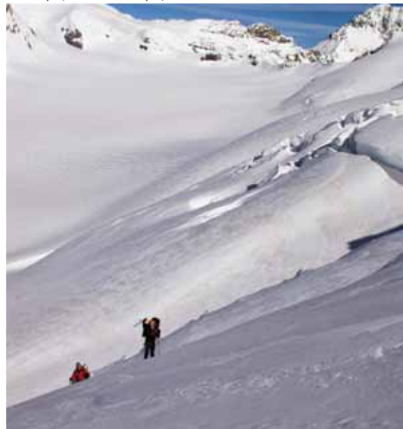
Dla takich widoków warto się trudzić.

Kilka tygodni temu zdobył trzy czterotysięczniki w Alpach Berneńskich w Szwajcarii. Towarzyszyło mu dwóch zaprzyjaźnionych taterników z Gliwic. Ekipa w ciągu trzech dni zdobyła trzy czterotysięczniki (Jungfrau - 4158 m n.p.m., Mönch - 4107