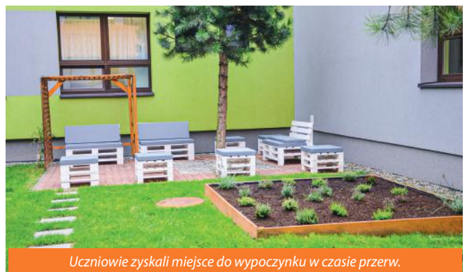
Uczniowie zyskali miejsce do wypoczynku w czasie przerw.