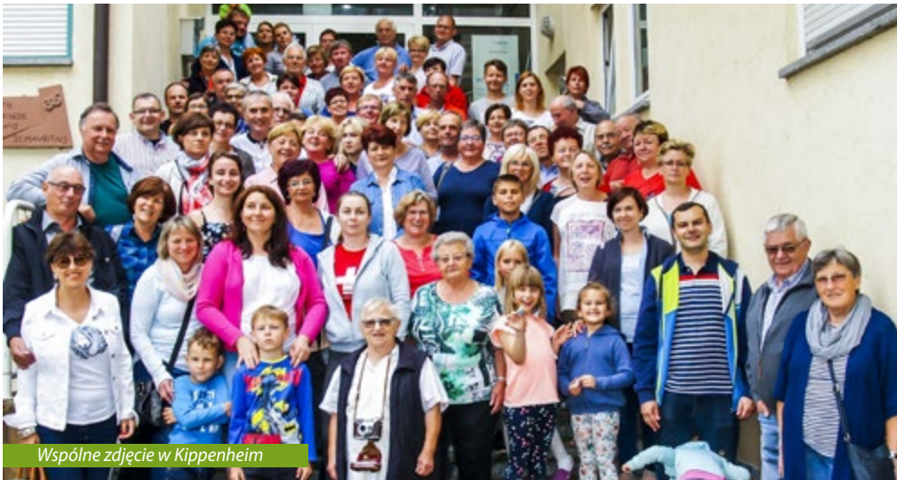
Wspólne zdjęcie w Kippenheim