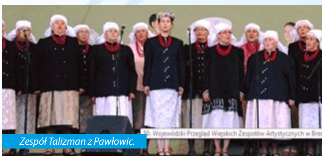
Zespół Talizman z Pawłowic.