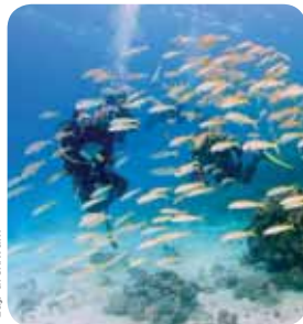
Egipt widziany pod wodą.