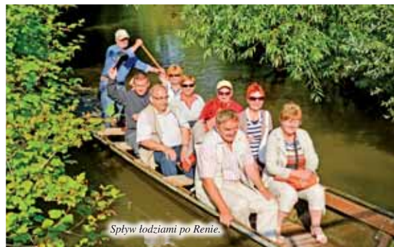
Spływ łodziami po Renie.