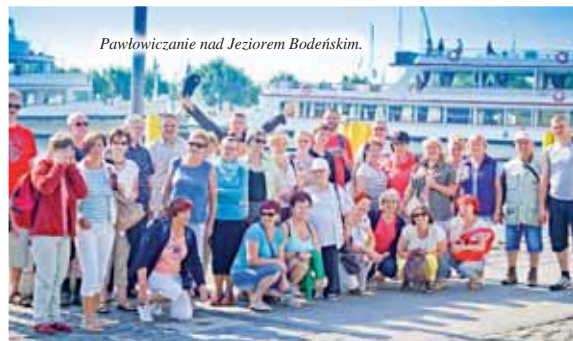
Pawłowiczanie nad Jeziorem Bodeńskim.

dnia, po śniadaniu i gorących podziękowaniach pawłowiczanie wyruszyli w drogę powrotną.