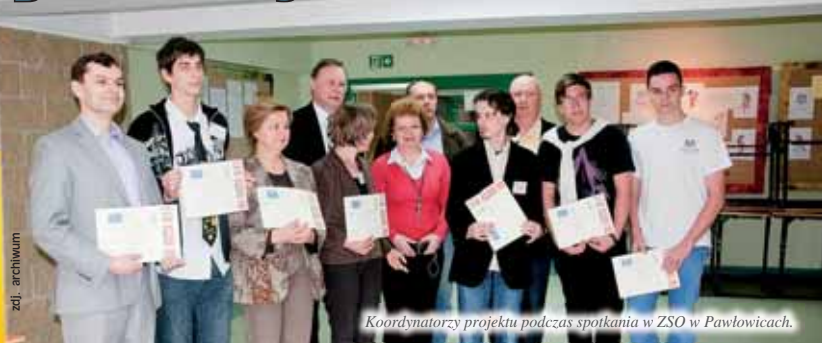
Koordynatorzy projektu podczas spotkania w ZSO w Pawłowicach.

Tak w wolnym tłumaczeniu brzmi angielskojęzyczna nazwa międzynarodowego projektu, który realizuje Zespół Szkół Ogólnokształcących w Pawłowicach.