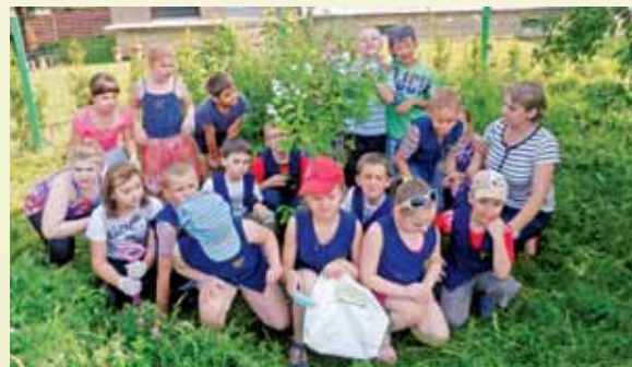
Drugoklasiści zasadzili klasowe drzewo. W drodze do szkoły będą przyspoglądać się jak rośnie.