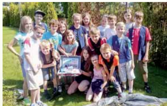
Uczniowie V klasy z kapsułą czasu, którą zakopali w ogrodzie.

Jeden z numerów „Racji Gminnych”, lusterko z fiata, monety i listy uczniów – to wszystko znalazło się w kapsule czasu, którą zakopano w ogródku. Za siedem lat kapsuła zostanie otwarta!