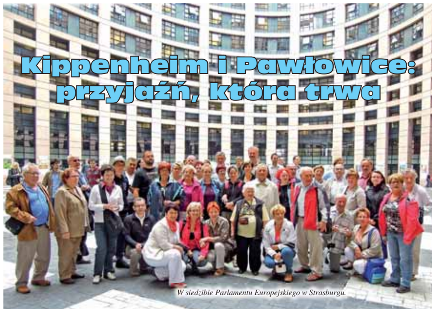
W siedzibie Parlamentu Europejskiego w Strasburgu.

Wieczorem, 28 czerwca uczestnicy zajęć EDU-s wyruszyli na tygodniową wycieczkę do zaprzyjaźnionego Kippenheim w Niemczech.