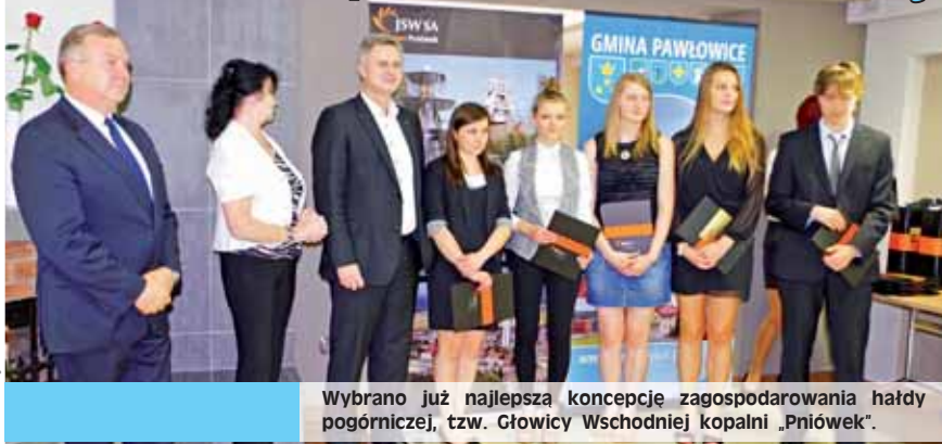
Wybrano już najlepszą koncepcję zagospodarowania hałdy pogórnicy, tzw. Głowicy Wschodniej kopalni „Pniówek”.