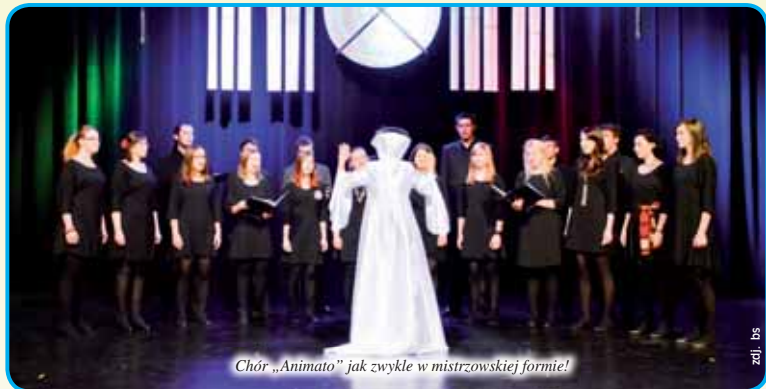
Chór „Animato” jak zwykle w mistrzowskiej formie!