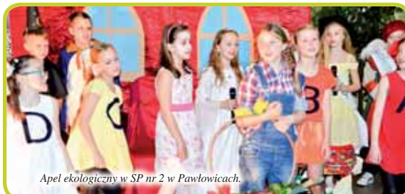
Apel ekologiczny w SP nr 2 w Pawłowicach.