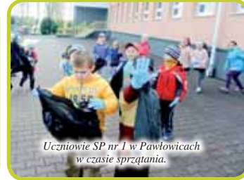
Uczniowie SP nr 1 w Pawłowicach w czasie sprzątania.