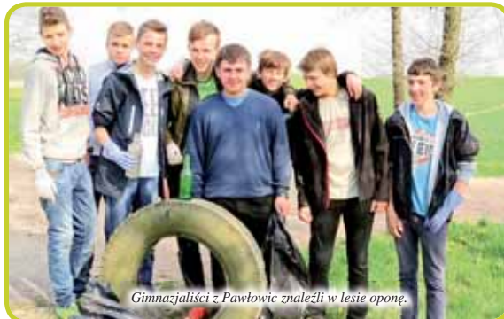
Gimnazjaliści z Pawłowic znaleźli w lesie oponę.