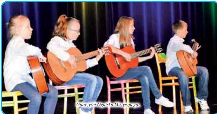
Gitaryści Ogniska Muzycznego.