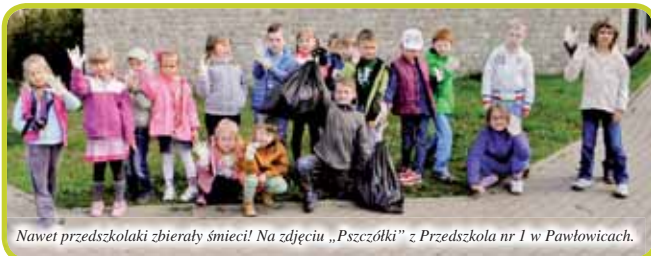
Nawet przedszkolaki zbierały śmieci! Na zdjęciu „Pszczółki” z Przedszkola nr 1 w Pawłowicach.