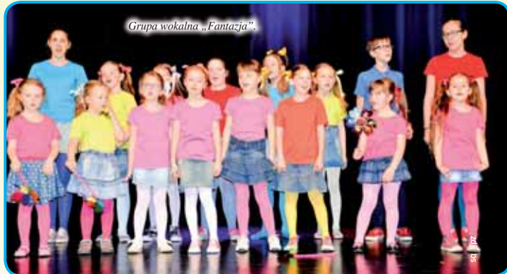
Grupa wokalna „Fantazja”.