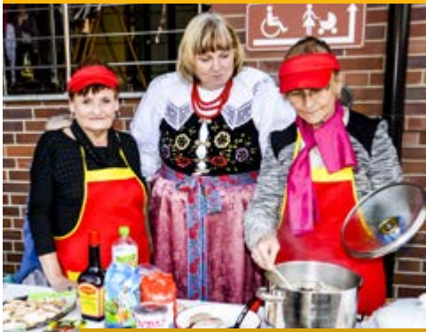
KGW z Pawłowic częstowało pysznym żurkiem.