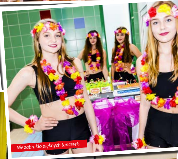
Nie zabrakło pięknych tancerek.