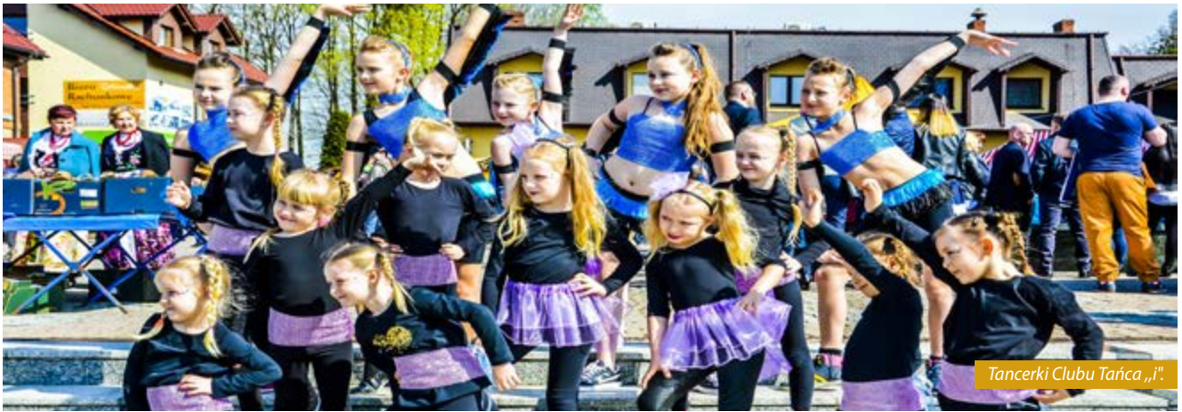
Tancerki Clubu Tańca „i”