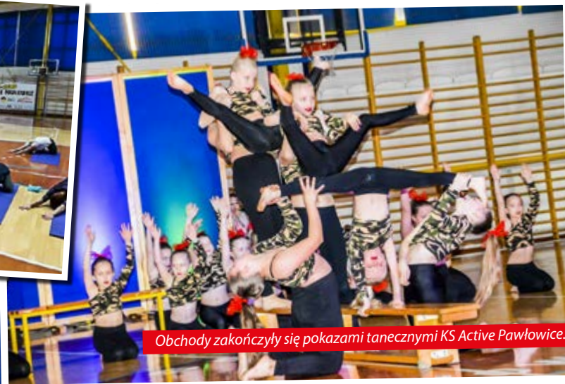
Obchody zakończyły się pokazami tanecznymi KS Active Pawłowice.