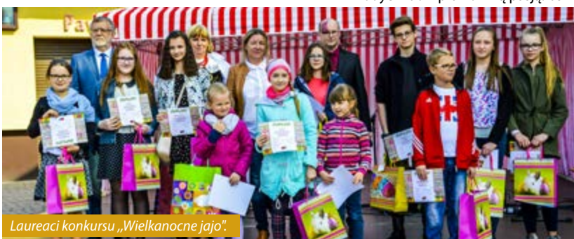
Laureaci konkursu „Wielkanocne jajo”.

Czas spędzony na jarmarku szybko mijał, a wypełniały go występy artystyczne zespołów śpiewaczych Talizman i Retro oraz grupy wokalne Fantazja działających przy Gminnym Ośrodku Kultury. Taneczną odsłonę przygotował Club Tańca „i”. Pełne energii pokazy w wykonaniu Black Milk Crew oraz tancerzy z grup Antidotum, Tiger Steps, Galaxy, Sweet Bubbles i dziewcząt z grupy jazzowej spodobały się widzom i pokazały, że taniec daje ogromną radość i jest dla wielu młodych ludzi prawdziwą pasją. bs