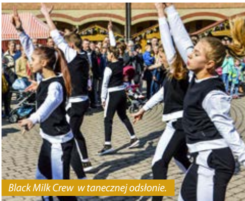
Black Milk Crew w tanecznej odsłonie.

Piękna pogoda zachęciła mieszkańców naszej gminy do wyjścia z domu i spędzenia niedzielnego popołudnia na Jarmarku Wielkanocnym, którego uroczyste otwarcie odbyło się w Niedzielę Palmową na placu przy Urzędzie Gminy.