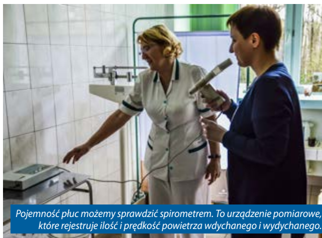
Pojemność płuc możemy sprawdzić spirometrem. To urządzenie pomiarowe, które rejestruje ilość i prędkość powietrza wdychanego i wydychanego.