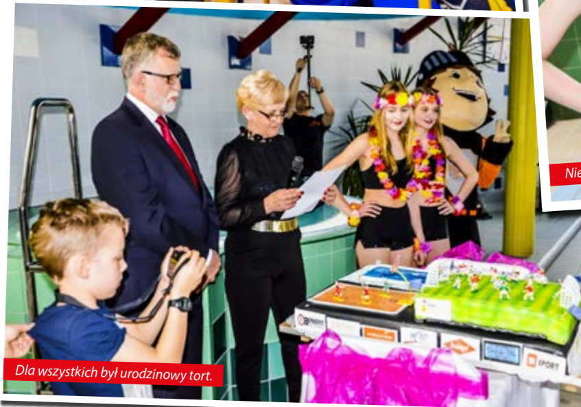
Dla wszystkich był urodzinowy tort.