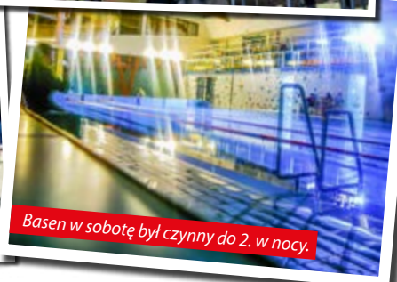
Basen w sobotę był czynny do 2. w nocy.