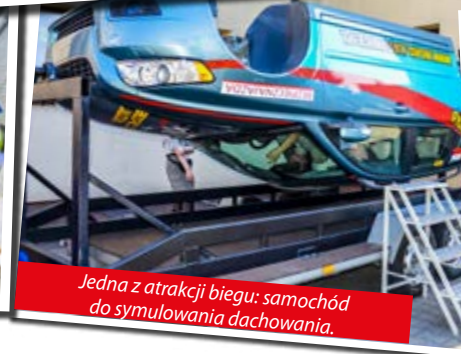
Jedną z atrakcji biegu: samochód do symulowania dachowania.