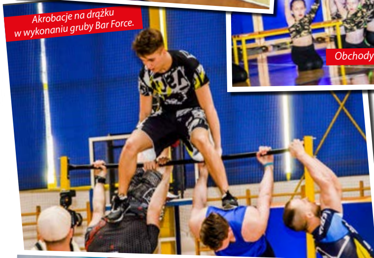
Akrobacje na drążku w wykonaniu grubego Bar Force.