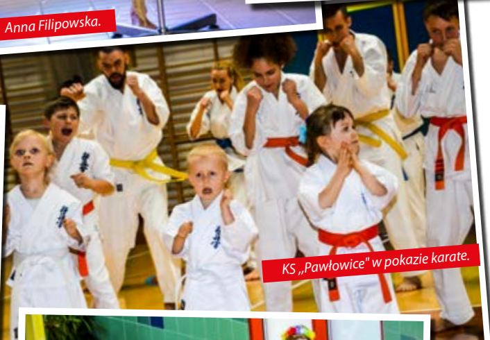
KS „Pawłowice” w pokazie karate.