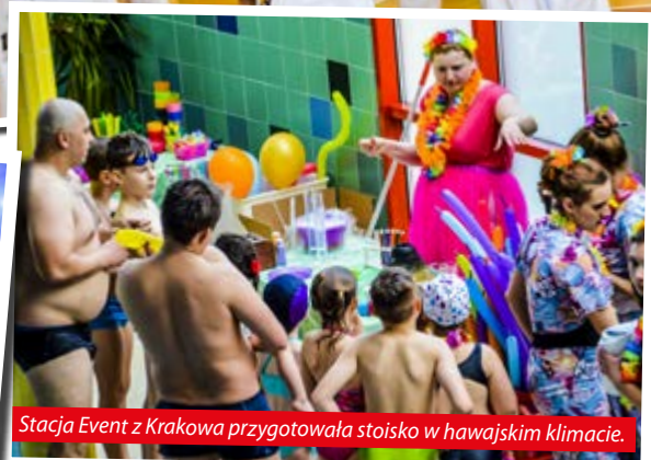
Stacja Event z Krakowa przygotowała stoisko w hawajskim klimacie.