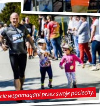
ie wspomagani przez swoje pociechy.