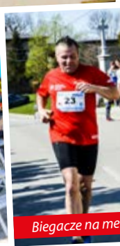
Biegacze na me...