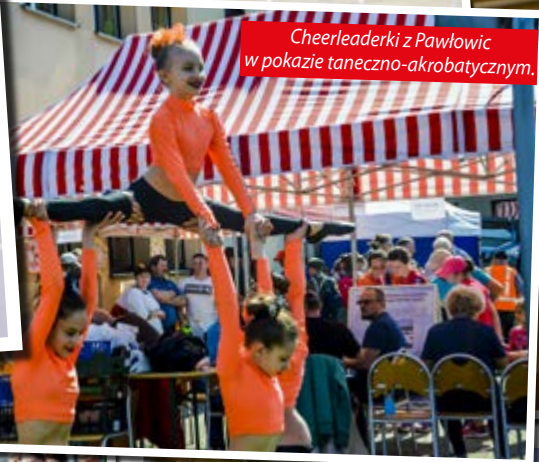
Cheerleaderki z Pawłowic w pokazie taneczno-akrobatycznym.