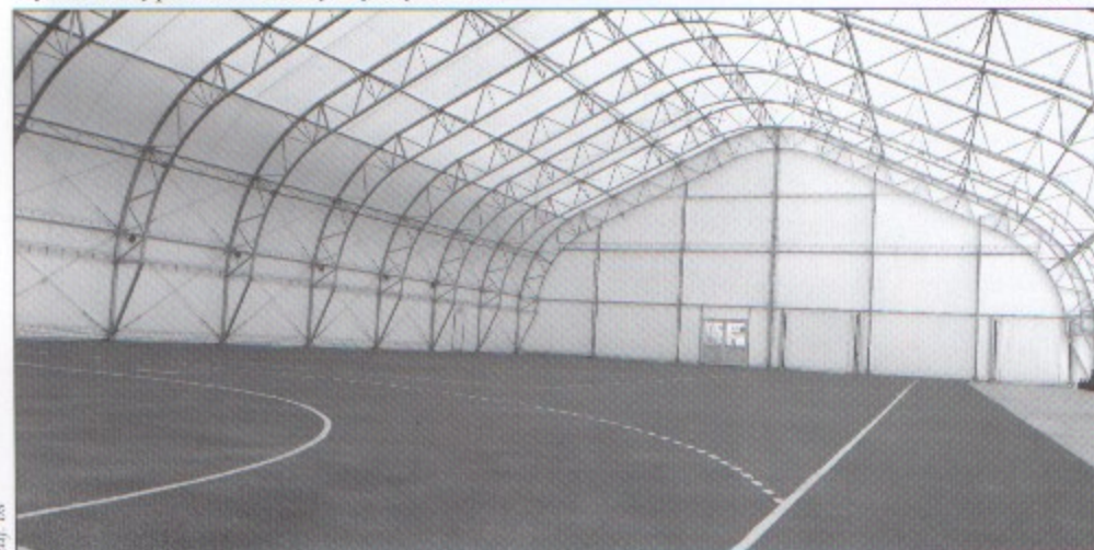
Sztuczna murawa pod zadaszoną częścią boiska będzie służyć do gry w siatkówkę oraz piłkę ręczną.