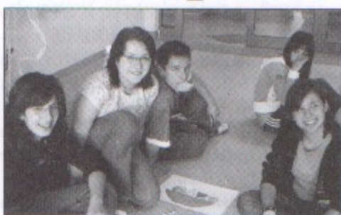
Tematem przewodnim spotkania było „Jedzenie w sztuce”.

Wizyta 19 uczniów z Turynu i Pitigliano we Włoszech oraz Badajoz w Hiszpanii odbyła się w ramach unijnego programu Sokrates Comenius. Na bazie tego programu realizowany jest projekt „Europejczycy wokół stołu”, dlatego tematem przewodnim spotkania było „Jedzenie w sztuce”. Zagraniczni goście wraz z licealistami z Pawłowic malowali obrazy z jedzeniem w roli głównej, wysłuchali muzyki biesiadnej w wykonaniu pawłowickiego zespołu śpiewaczego Talizman oraz później, już w swoich szkołach poznają naturalne sposoby leczenia dolegliwości bólu głowy, brzucha i domowych sposobów na przeziębienie. Projekt będzie realizowany w ciągu 3 lat, a każda szkoła pracuje nad nim także w swoich miejscowościach. Jego realizacja jest finansowana ze środków Unii Europejskiej. Ponieważ środki te są jednak ograniczone, zagraniczni goście w czasie pobytu w Polsce nocowali w polskich rodzinach, które zapewniały im nocleg, wyżywienie, także dbały o to, aby naszym gościom się nie nudziło. – Przede wszystkim staraliśmy się pokazać gościom naszą miejscowość, a tak-