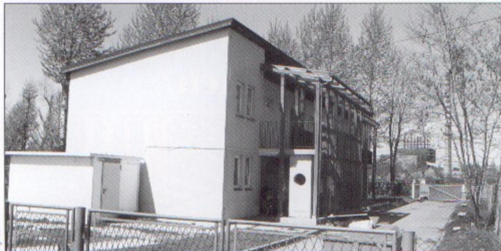
Wkrótce dom socjalny powiększy się o 11 nowych mieszkań.

Istniejący budynek zostanie rozbudowany o jedną kondygnację nad obecnymi mieszkaniami oraz o całkiem nową część z 6 mieszkaniami, która zostanie dobudowana od strony Domu Kultury. W sumie powstanie 11 mieszkań. bs