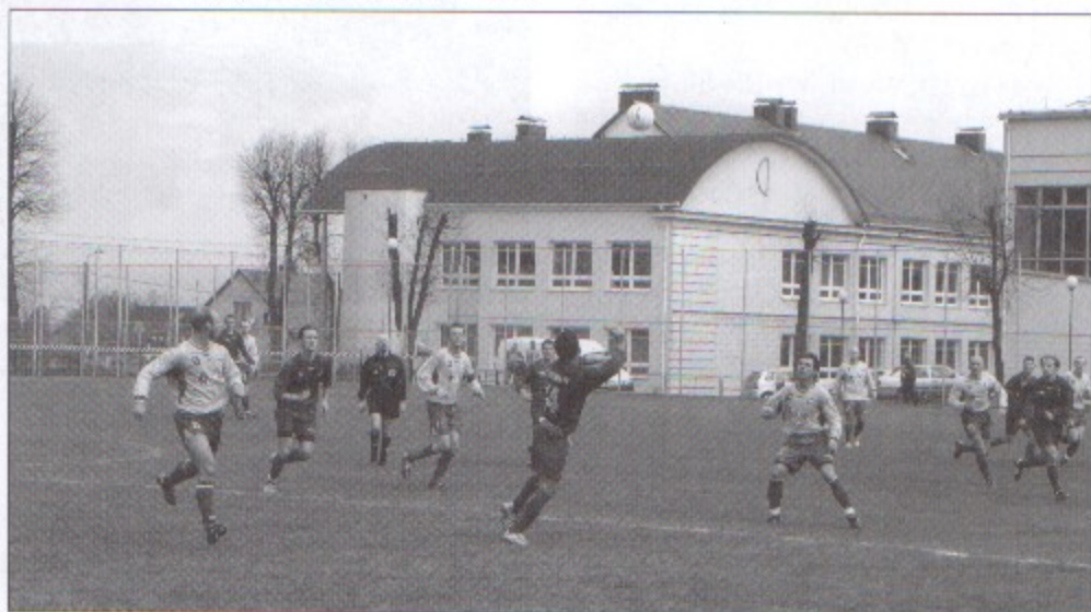
Być może na boisku GKS Pniówek będą trenować najlepsi piłkarze Europy.