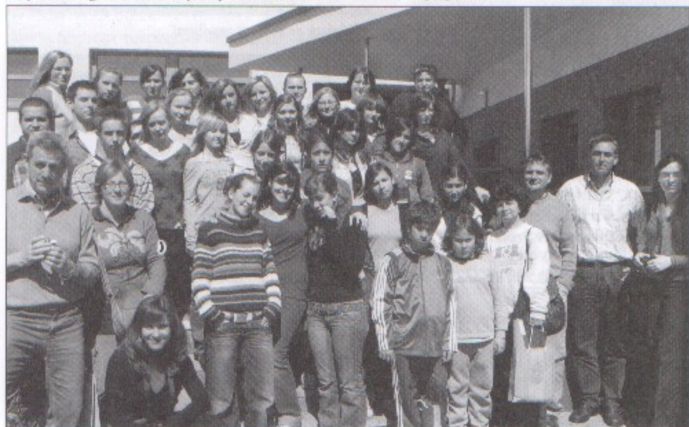
Młodzież z Włoch i Hiszpanii wraz z licealistami z Pawłowic, którzy gościli ich w swoich domach.

W Hiszpanii o wiele częściej widzi się piętrowe domy – jest też mniej zieleni. Polska jest krajem bardzo czystym i zauważyłyśmy się, że Polacy bardzo dbają o swoje domy i ogródki. Tutaj nikt nie maluje ścian w korytarzach, a u nas się to niestety często zdarza. W naszej szkole jest też więcej hałasu. Ceny w Polsce są niższe niż w Hiszpanii. Nie dotyczy to jednak owoców, które są tutaj o wiele droższe. Na pamiątkę z podróży weźmiemy biało-czerwone szale z napisem „Polska” i chętnie zabrałybyśmy też jakiś chłopaków, bo są przystojni i mają piękne oczy.