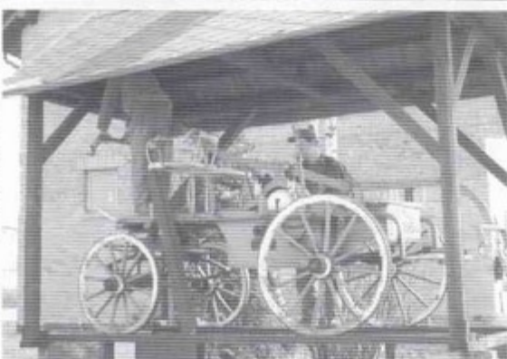
Cały teren rynku jest monitorowany przez kilkanaście kamer.

Kompozycje iglaste znajdują się również na pobliskim rondzie, a wóz strażacki przy placu zostanie pomalowany. Będzie pięknie! bs