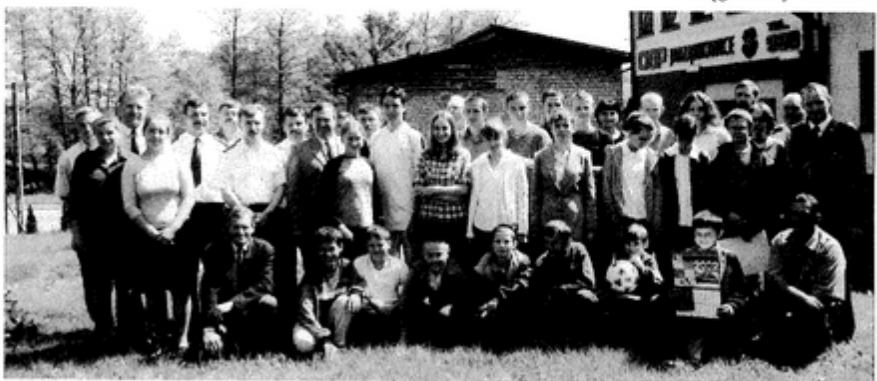
Pamiątkowe zdjęcie uczestników i organizatorów turnieju