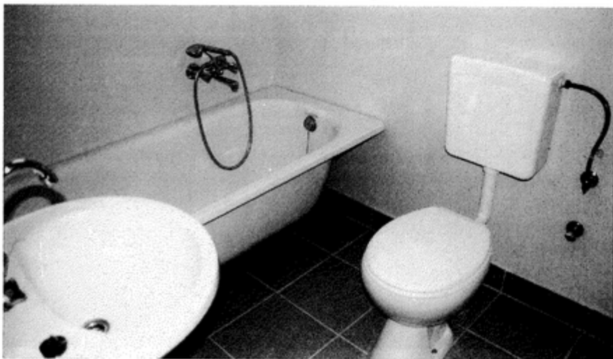
... i od środka

OSP i Rada Sołecka Krzyżowic zapraszają na FESTYN MAJÓWKĘ