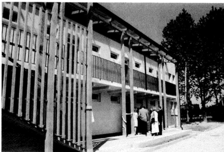
Dom Socjalny z zewnątrz...

Czy tak się stanie zależeć będzie przede wszystkim od lokatorów.