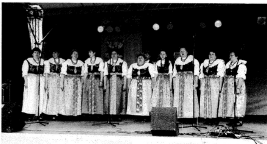
Zespół "Niezapominajki" w pełnej krasie