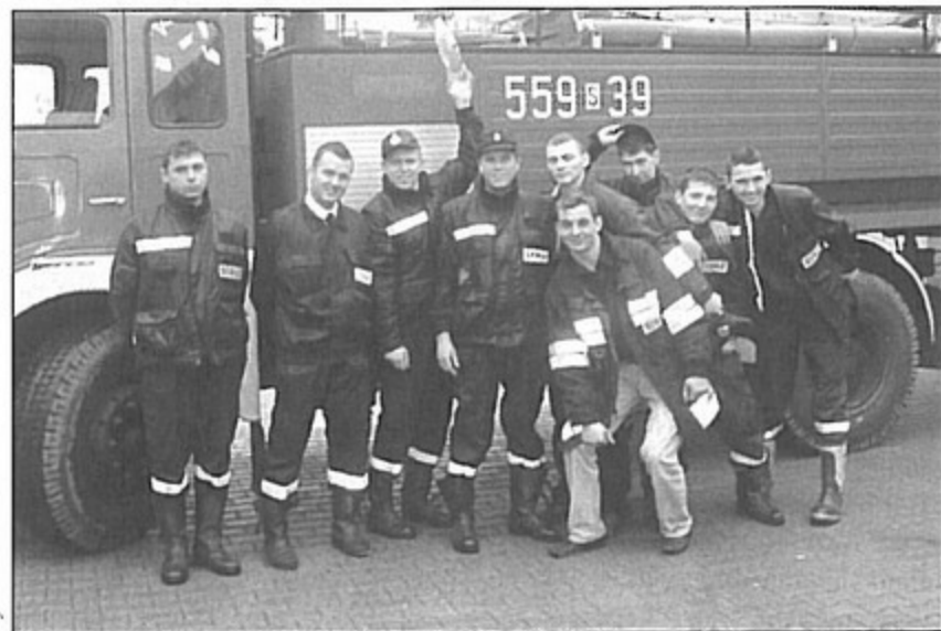
Strażacy tuż przed dyngusową akcją.

Tradycja polewania wodą została zapoczątkowana w Warszowicach na początku lat 80. przez śp. Floriana Wowrę. Wtedy strażacy jednak tak się nie patyczkowali i woda lala się wiadrami. Zgodnie ze zwyczajem, za polanie wodą mieszkańcy obdarowują strażaków wiejskimi jajkami. W tym roku było to 500 jaj, z czego 200 poszło na jajecznicę. Jest już bowiem tradycją, że po zakończeniu dyngusa, strażacy spotykają się w remizie na wspólnym smażeniu tej potrawy. bs