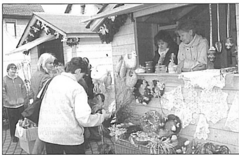
Pawłowicki jarmark cieszy się coraz większym powodzeniem.

W s z y s t k o odbyło się pod hasłem powrotu do tradycji. Pawłowicki jarmark okazał się niepowtarzalną okazją, by w jednym miejscu kupić naturalną żywność i unikatowe, ręcznie wykonane prezenty na zajączka.