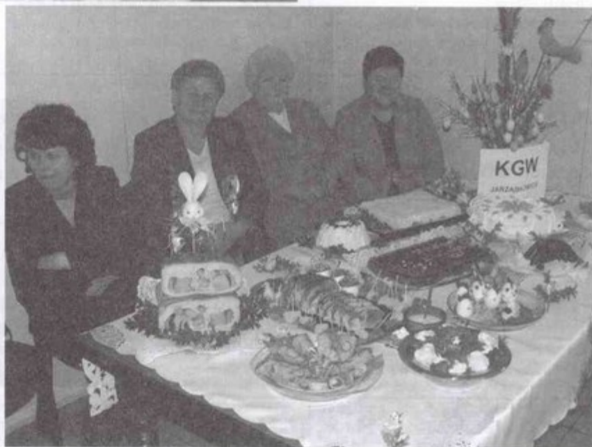
Stół przygotowany przez koło gospodyń z Jarząbkowic