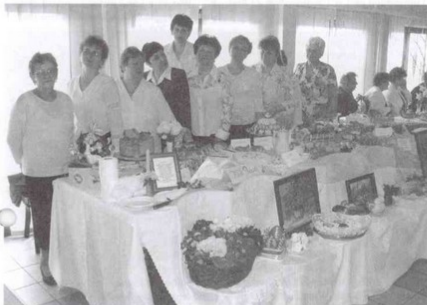
Wielkanocny stół KGW w Pniówku.

Na wielkanocnych stołach przybranych ręcznie haftowanymi serwetkami i ozdobami świątecznymi można było zobaczyć i skosztować tradycyjnych potraw Wielkiej Nocy przygotowanych przez Koła Gospodyń Wiejskich z terenu naszej gminy.