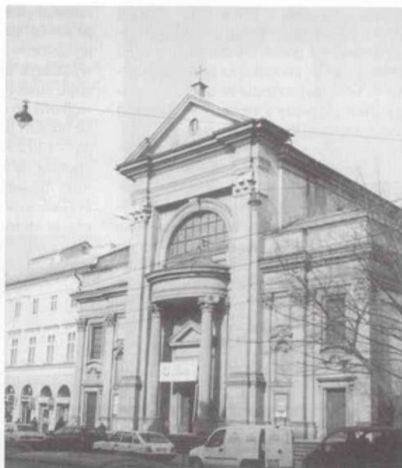
Stradom w Krakowie.