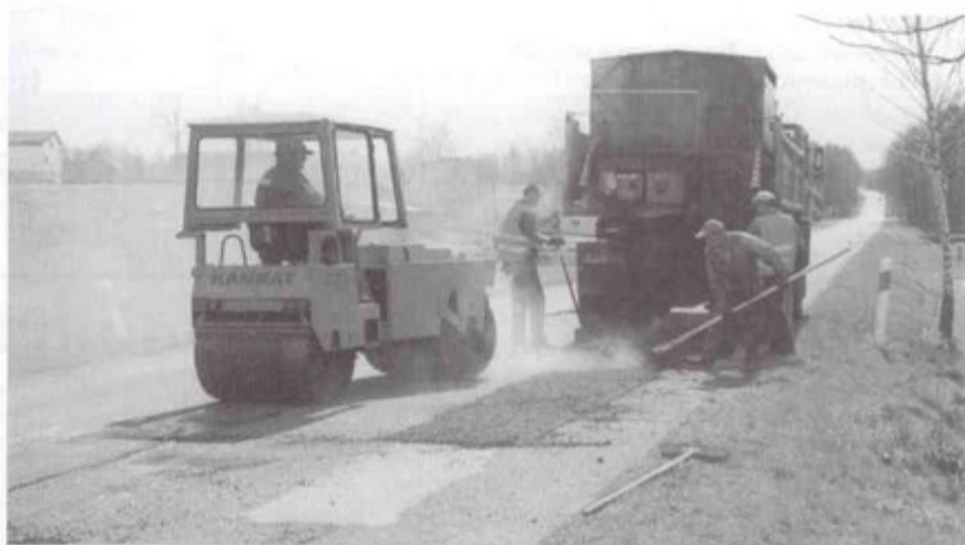
Pracownicy firmy Kamrat latają dziury na drodze prowadzącej do Cieszyna.

W celu usprawnienia prac na drogach publicznych przebiegających przez teren