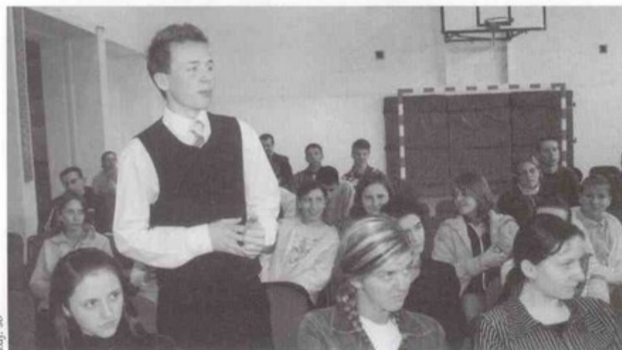
Tylko nieliczni licealiści odważyli się na zadawanie pytań.