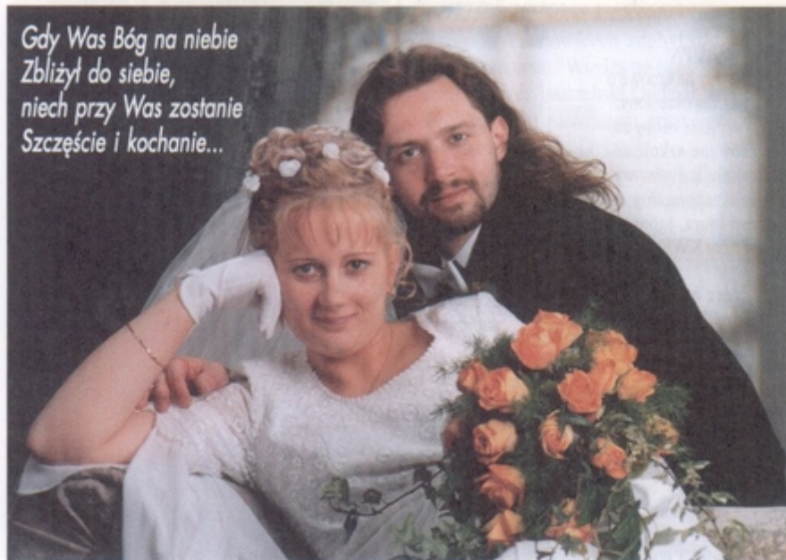
6 kwietnia, sakramentalne "TAK" powiedzieli sobie: