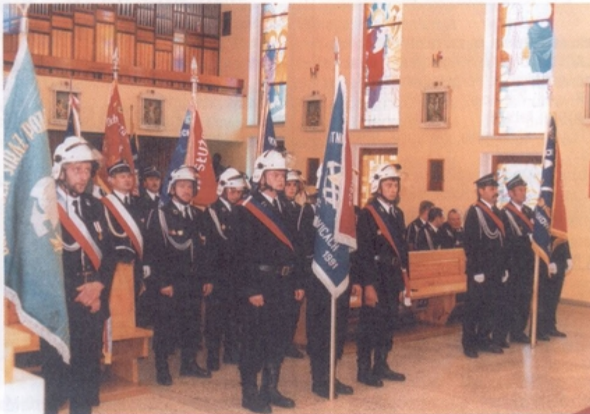
Strażackie poczty sztandarowe stanęły w golasowickim kościele