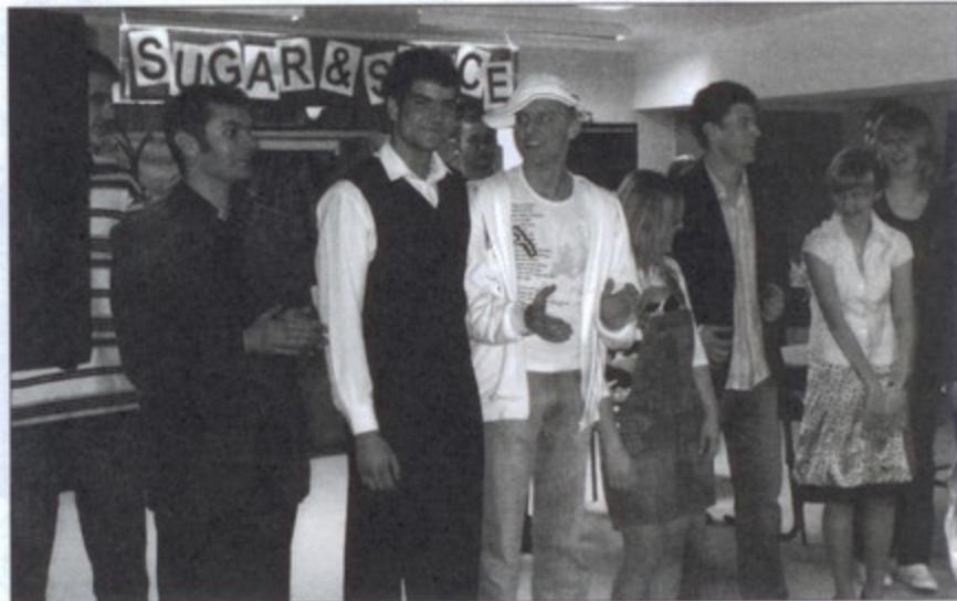
Młodzieżowa sztuka zachwyliła licealistów.