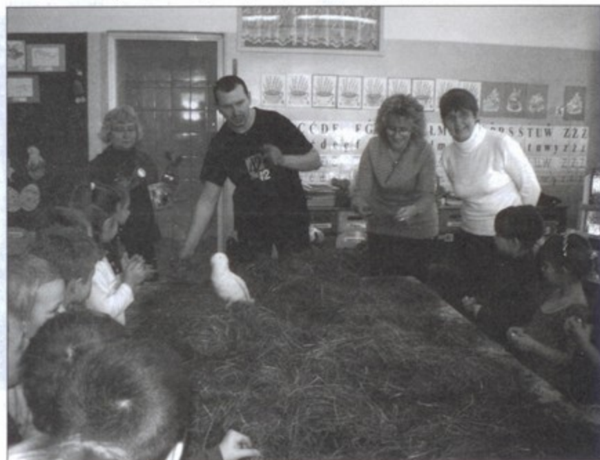
Warsztaty twórczości ludowej z artystami ze Stryśzawy.