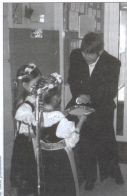
Przedsiębiorcy witają gości.

Ukazanie tradycji i kultury polskiej, a zwłaszcza zwyczajów Świąt Wielkanocnych postawiło sobie za cel Przedszkole w Modrzewiowym Ogrodzie, które w połowie marca gościło dwóch zagranicznych gości.