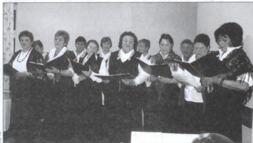
Występ „Jarząbkowianek” spotkał się z wyjątkowym przyjęciem.

Podczas uroczystości nie obyło się bez wielu serdecznych życzeń. W miłej atmosferze bawiono się do późnych godzin wieczornych. bs