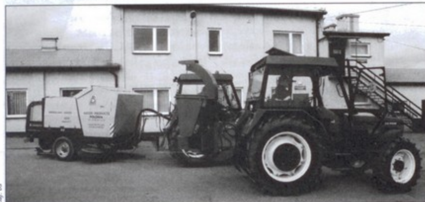
Nowe nabytki GZK: traktor i rozdrabniacz do gałęzi.

Do tej pory, GZK dysponował tylko jednym traktorem, który był używany zarówno do zamiatania ulic, jak i wycinki drzew. bs