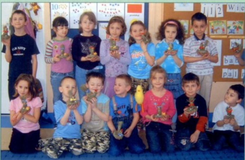
Przedszkolaki z Pawłowic z dumą prezentują wykonane przez siebie ozdoby.