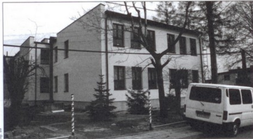
Możliwe jest uzyskanie dofinansowania na remont szkoły w Krzyżowicach.

Pomoc finansowa z Funduszy Europejskich, z której Polska będzie korzystała do 2013 roku przyznawana jest w ramach poszczególnych programów operacyjnych, odrębnych dla każdego z województw. Wbrew temu co mówią jednak media, nie jest łatwo sięgnąć po obiecywane środki pieniężne.