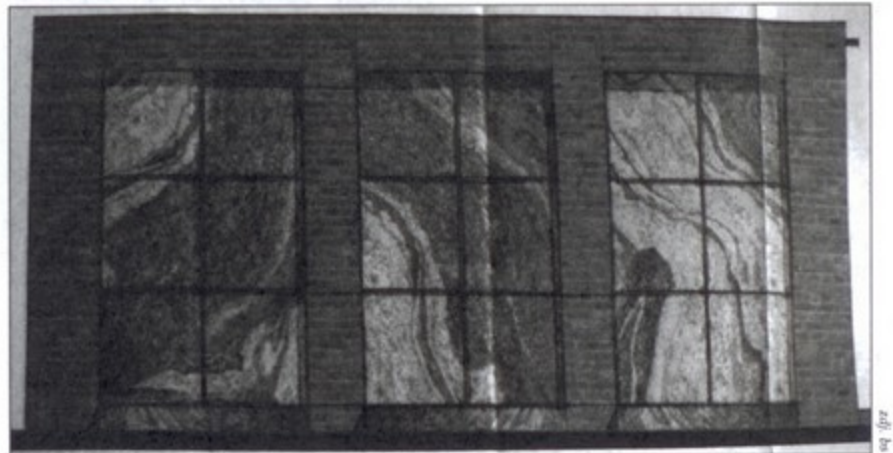
Projekt kolumbarium, które powstanie na cmentarzu komunalnym w Pawłowicach.

Każdą niszą zamyka płyta marmurowa, na której będzie można umieścić napis. Pod niszą znajdzie się postument obłożony marmurem, przeznaczony na znicze i kwiaty. bs