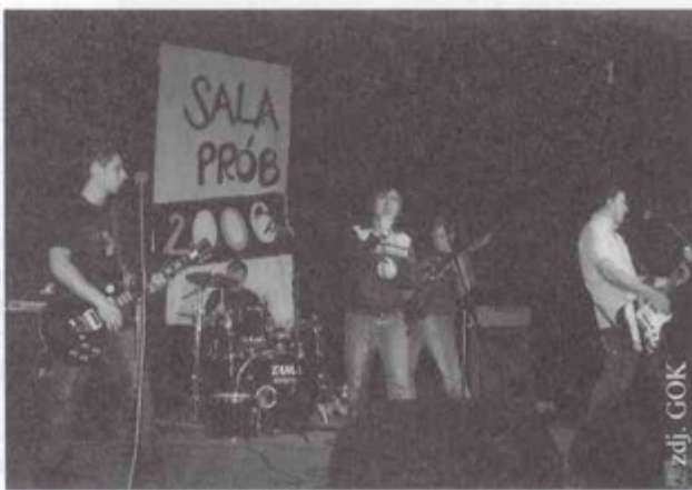
El Secatorre z Tychów - zwycięzca przeglądu.