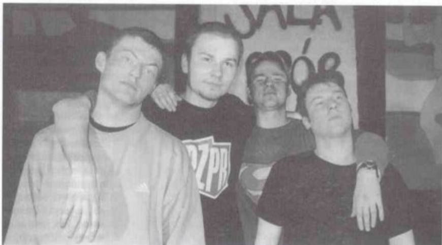
Przełom wygrał tyski zespół Insekt grający nowoczesny rock.

Do tradycji przeglądu należy już fakt, że laureat pierwszego miejsca daje koncert i odbiera nagrodę podczas "Dni Pawłowic".