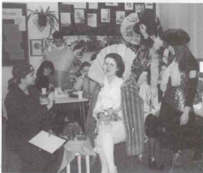
Licealiści z Gilowic w czasie scenki prezentującej Ludwika XIV.

historii i geografii Francji, a zwłaszcza znajomości Wersalu i Bretanii. Potrzebnych in-