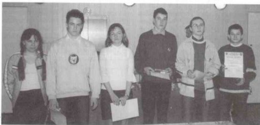
Finaliści gminnego konkursu wiedzy pożarniczej.

Ponieważ tylko w Pawłowicach organizowane są eliminacje gminne, dlatego ich zwycięzcy będą reprezentować powiat podczas turnieju wojewódzkiego. Turniej odbędzie się w maju. Trzymamy kciuki! sb