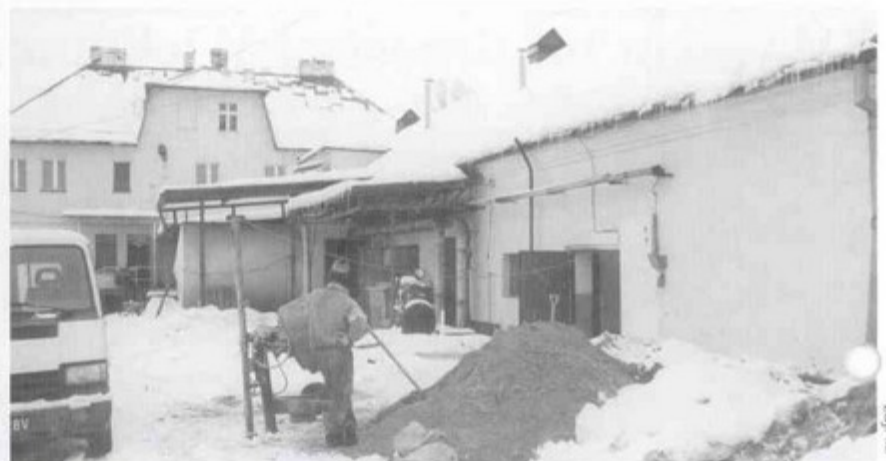
W lutym przystąpiono do modernizacji spółdzielni.

to od opracowania biznes planu i zgodnego z dyrektywami Unii Europejskiej programu restrukturyzacji zakładu, który musi uzyskać akceptację powiatowego lekarza weterynarii. Poręczyтелем kredytu została gmina, która podjęła taką decyzję na marcowej se-