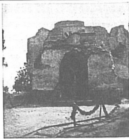
Ten sam kościół po zburzeniu go przez Niemców w marcu 1945 r.