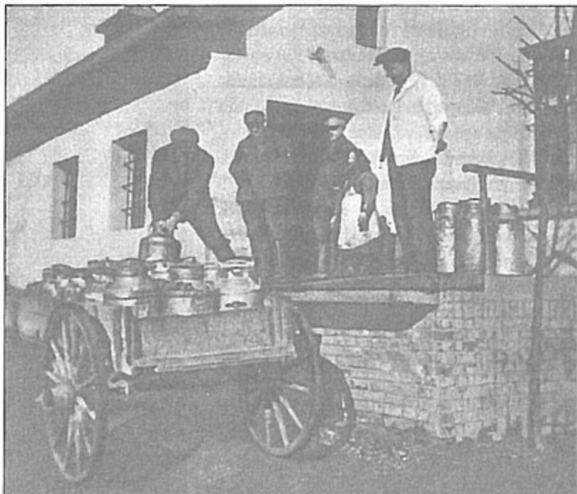
Tak wyglądał kiedyś odbiór mleka przywożonego z okolicznych wiosek.

pozyskać i po pracach remontowych zaczęto produkować twaróg metodą wirówkową. Pawłowskim zakładem zaczęła się też interesować Okręgową Spółdzielnia Mleczarska we Włoszczowie. Dziś nasza mleczarnia jest jej oddziałem i całkiem dobrze sobie radzi. Każdego dnia przerabia średnio 15 tys. litrów mleka. Produkuje „Serek pawłowski” w dużych wiaderkach 11-kilogramowych, twaróg krajankę o wadze 1 kilograma oraz kostki twarożku po 250 gramów i serek typu włoskiego carjatta, który potarty na wiórki trafia do pizzerii. Od grudnia 2008 roku nastąpił znaczny wzrost produkcji. W styczniu ubiegłego roku zakład wyprodukował 37 ton serów. – W październiku podbiliśmy rekord. W 15 osób wyprodukowaliśmy 70 ton twarogu, głównie krajanki. W ciągu roku produkcja wzrosła o 160 procent. Przed świętami pracowaliśmy