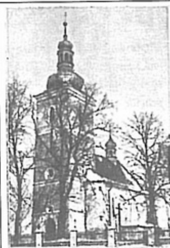
Kościół parafialny w Pawłowicach wybudowany w 1596 r., przed zburzeniem.

- W 1945 roku miałem 7 lat. Mieszkaliśmy przy obecnej ul. Świerczewskiego. Wtedy przy tej drodze było zaledwie kilka zabudowań, a nasz dom był jednym z ostatnich. W czasie działań wojennych, na piętrze naszego domu znajdował się punkt opatrunkowy. To tutaj udzielano pierwszej pomocy Niemcom, których przywożono z frontu. My przez 6 tygodni mieszkaliśmy w piwnicy. Za oświetlenie służyły nam lampy naftowe i świece, ogrzewaliśmy się piecykiem tzw. żelazniakiem. W czasie ataku bardzo się baliśmy: kobiety modliły się, a dzieci krzyczały. Pamiętam, że któregoś razu pocisk trafił w komin. Powpadały do niego cegły, a znajdująca się na jego ścianach sadza wydostała się przez piec do pomieszczenia piwnicy. Jak zapaliliśmy światło, to oniemieliśmy. Wszyscy wyglądaliśmy jak kominiarze. Był jeden wielki śmiech - opowiada