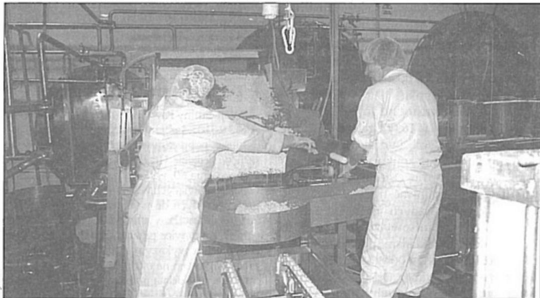
Dzisiaj w pawłowskiej mleczarni produkuje się twaróg oraz ser typu włoskiego.

Formularze wniosków dostępne są w Punkcie Obsługi Klienta Urzędu Gminy oraz na stronie internetowej http://www.pawlowice.pl/biuro/karty_fn/fn16.php .