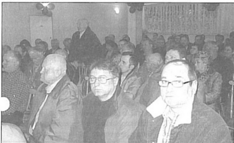
Mieszkańcy Warszowic pytali o sprawy związane z dwupasówką.

Rozwiązywaniem problemów interwencyjnych zajmą się teraz poszczególne referaty urzędu gminy, zaś wnioski o charakterze inwestycyjnym trafią pod obrady Rady Gminy i – jeśli radni je zatwierdzą do realizacji – zostaną w miarę posiadanych środków wpisane do planów budżetowych. Jak zauważyli mieszkańcy, to że pytań było tak dużo, nie oznacza wcale, że działania gminy idą w złym kierunku. Jest wprost przeciwnie, podczas wszystkich zebrań mieszkańcy bardzo pozytywnie ocenili działalność władz gminy, podkreślając znaczny rozwój wszystkich sołectw i wielość inwestycji. bs