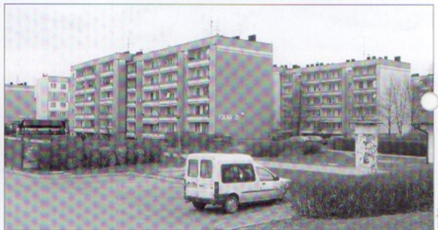
Nową elewację zyskają w tym roku cztery nowe bloki.

Ponadto spółdzielnia będzie wymieniać okna, wodomierze oraz prowadzić inne prace mające na celu poprawienie infrastruktury Osiedla. bs