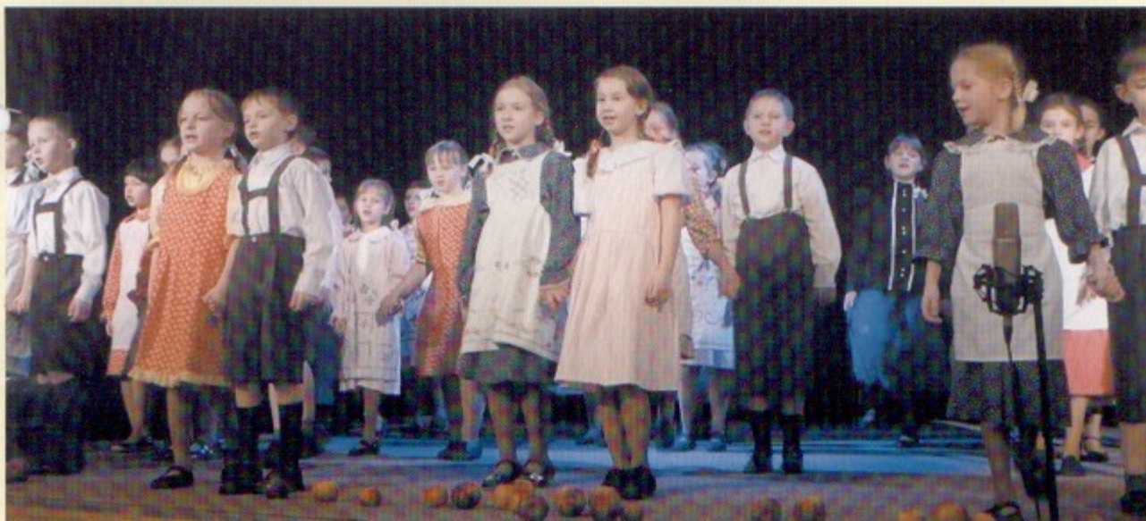
Nowy dziecięcy zespół podbił już serca widzów.

Podczas ostatnich spotkań organizowanych w Pawłowicach i Pniówku debiutował nowy zespół dziecięcy działający przy Gminnym Ośrodku Kultury. Piękne, oryginalne stroje, wyliczanki i piosenki z czasów dzieciństwa naszych babć i dziadków to jego znak rozpoznawczy.