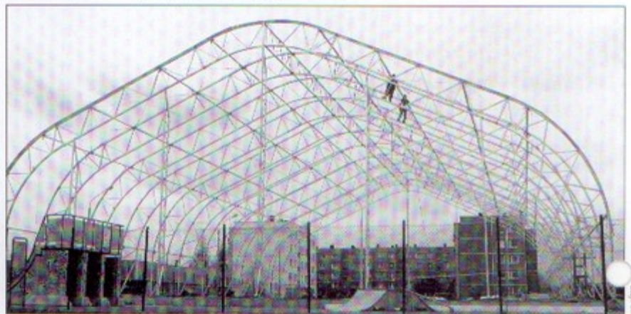
Widać już konstrukcję hali namiotowej.

chłodniczego każdej zimy będzie zamieniała boisko w lodowisko. Natomiast wiosną i latem obiekt będzie używany jako boisko sportowe do gry w piłkę ręczną, siatkówkę i w piłkę nożną. Prace będą prowadzone do końca października, a ich wykonawcą jest firma Hefal z Wodzisławia Śl. bs