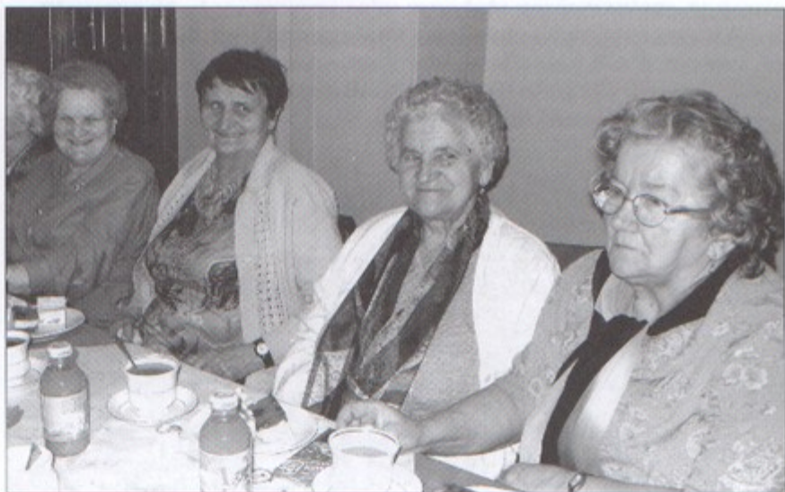
Jak dobrze jest być emerytem w takim kole, jak pawłowickie.

To jednak dopiero jesienią, a wcześniej odbędzie się „majówka”. Na wolnym powietrzu, przy ognisku, emeryci będą smażyć kielbaski i śpiewać. bs