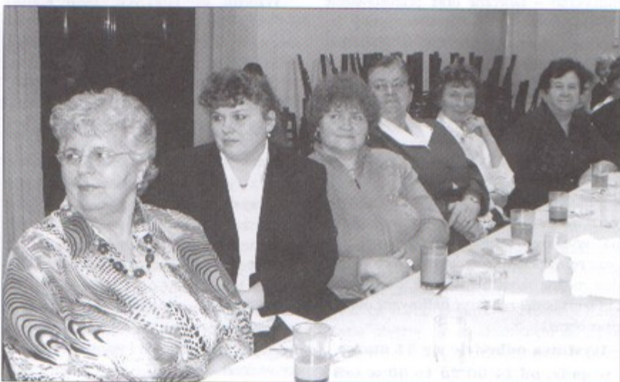
Od wielu już lat mieszkanki Pniówka spotykają się na uroczyszym spotkaniu z okazji Dnia Kobiet.