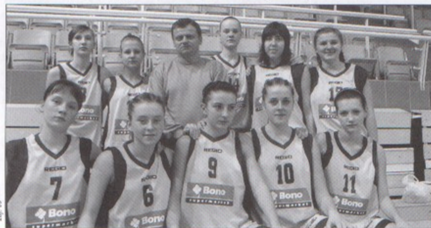
Radny z drużyną koszykarek.