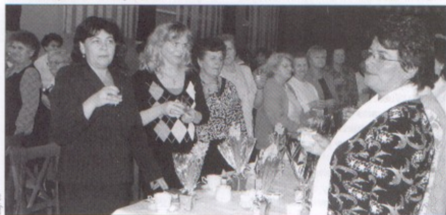
Toast za pomysłność członkiń KGW w Pawłowicach.

Dzień Kobiet to jedna z wielu imprez organizowanych przez pawłowickie Koło Gospodyń Wiejskich. Co roku odbywa się także spotkania z okazji Dnia Babci i Dziadka, biesiady oraz wycieczki. Gospodynie były już m.in. w Krakowie i nad Jeziorem Turawskim, a także na Słowacji i w Warszawie. W planie na ten rok mają wyjazd do Kalnej, trzydniową wycieczkę do Kazimierza Dolnego, Puław, Lublina i Zamościa, a także biesiadę jesienną w październiku. Najważniejszą uroczystością, jaka czeka panie w tym roku, będą jednak obchody 60-lecia istnienia Koła, które zaplanowane są na 9 września. bs