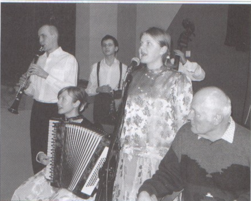
Zespołowi taneczno-śpiewaczemu towarzyszy kapela.