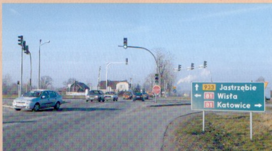
Już niedługo przez to skrzyżowanie nie będzie można jeździć na wprost.