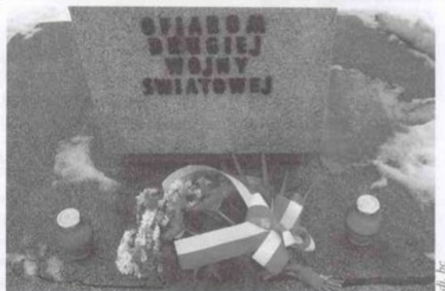
Hold zabitym oddano pod pomnikiem Ofiar II Wojny Światowej.