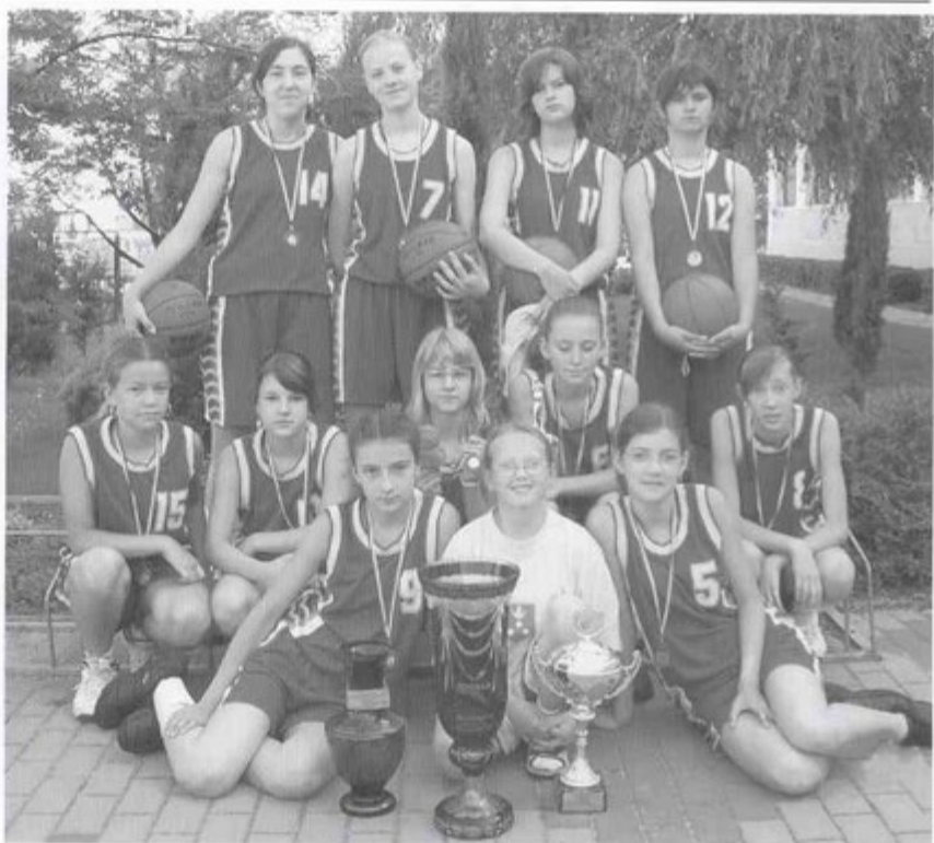
Drużyna młodziezek starszych drugi raz z rzędu wygrała Mistrzostwa Śląska w piłce koszykowej.