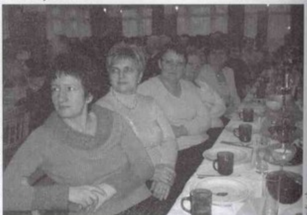
Uczestniczki biesiady zorganizowanej z okazji Dnia Kobiet.

humorystycznych skeczy i inscenizacji ludowych, z których tak byli znani w okolicy. Dotyczyły one najczęściej aktualnych i konkretnych okoliczności, które ogólnie można określić jako „z życia wzięte”. Tym razem była to historia kobiety, która chciała na 5 minut pożyczyć cudzego męża, bo jej partner życiowy w tym czasie odchudzał się w sanatorium. Przedstawienie było zna-