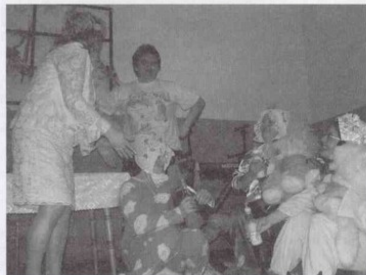
Zabawny skecz w wykonaniu „Harmonii”.