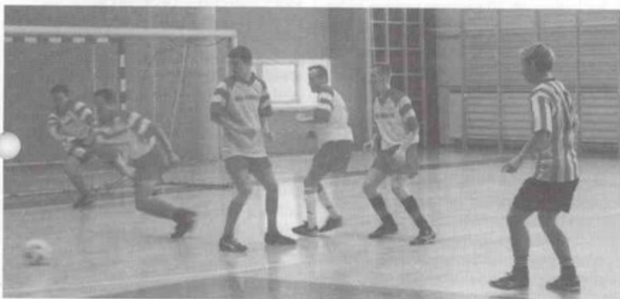
W finale zawodnikom Pniówka udało się pokonać LKS Osiedle.

Drużyny biorące udział w turnieju podzielono na trzy grupy, a do drugiej fazy rozgrywek awansowały po dwie najlepsze z