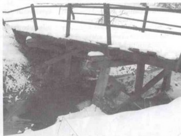
Wkrótce most w rejonie ul. Jasnej nie będzie już straszyl. W tym miejscu pojawi się nowoczesna kładka dla pieszych.

ny i Urząd Wojewódzki. W budżecie gminy już zarezerwowano na ten cel 500 tys. zł. O 100 tys. więcej wygospodarowano w województwie. Ale to właśnie do nich należy sfinansowanie regulacji Pielgrzymówki. sb