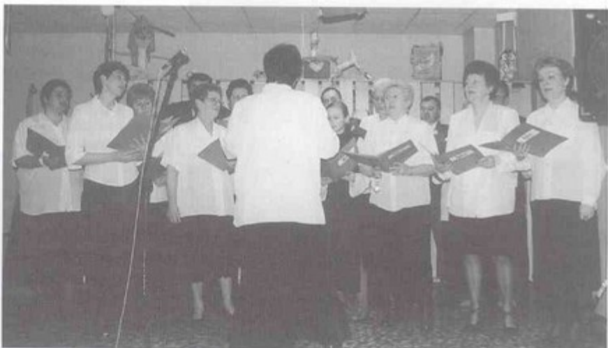
Zespół „Retro” podczas pierwszego występu.

- Nie przeszkadza mi fakt, że jestem tu-