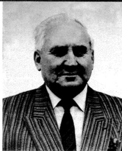
sowic, Warszawic , a niektórzy nawet do Ruptawej.

- Pniówek to wioska „podzielona”. Większość mieszkańców kieruje swe dzieci na lekcje do szkoły w Bziu. Obecnie uczęszcza tam 56 naszych uczniów, podczas gdy do Pawłowic tylko 14. Jesteśmy związani z Bziem nie tylko poprzez szkołę, ale i parafię. Gro katolików na msze chodzi do Bzia, natomiast pozostali do Krzyżowic i Pawłowic. Ewangelicy zaś na nabożeństwa dojeżdżają do Gola-