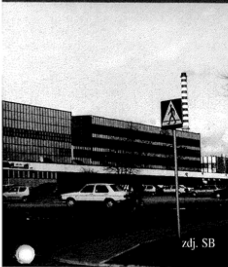
tego "Pniówek" związane są zarówno wpływy do zody górnicze