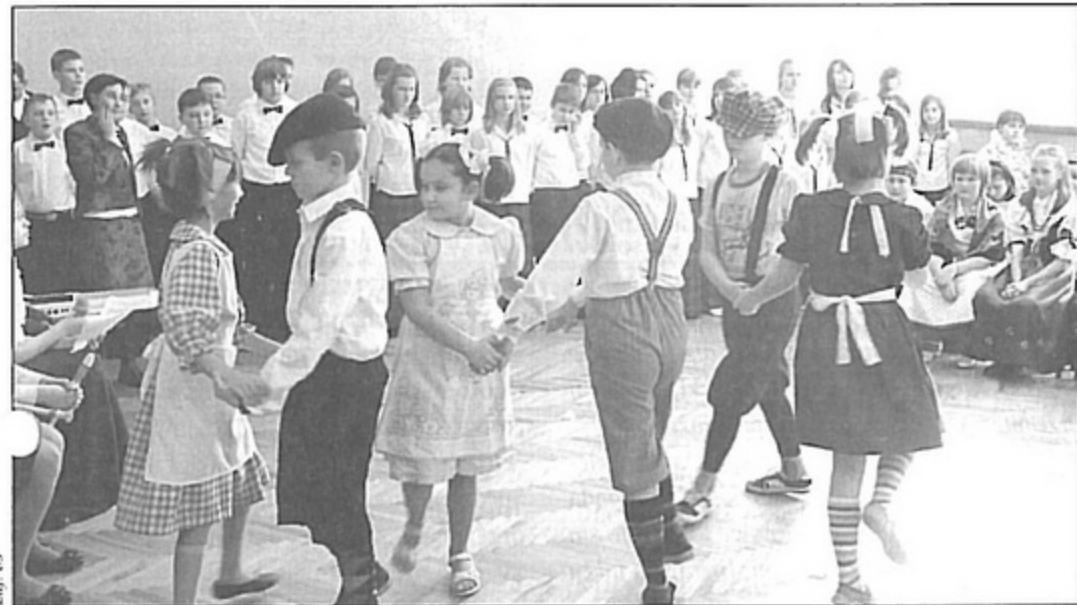
Trzecioklasiści zachwycili pięknymi strojami.