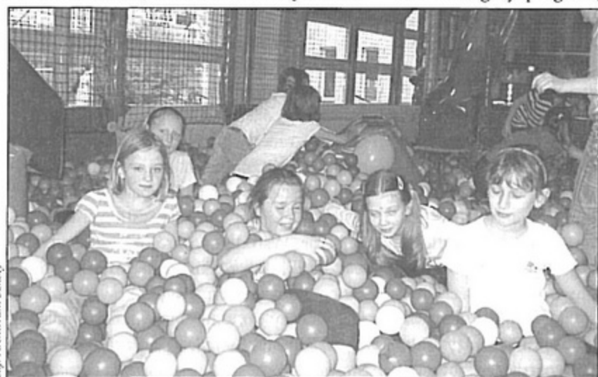
Uczniowie klas II i III w Figlolandii w Jastrzębiu Zdroju.

W tym roku po raz pierwszy, w ramach środków z budżetu gminy, w każdej szkole naszej gminy odbywały się w czasie ferii zajęcia sportowe. Nauczyciele przygotowali bardzo bogaty program, dzięki czemu czas