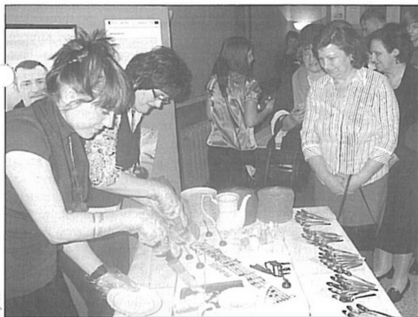
Nuty słynnego poloneza Fryderyka Chopina znalazły się w dekoracji olbrzymiego tortu, który dla uczestników koncertu przygotowała cukiernia TAD z Pawłowic.