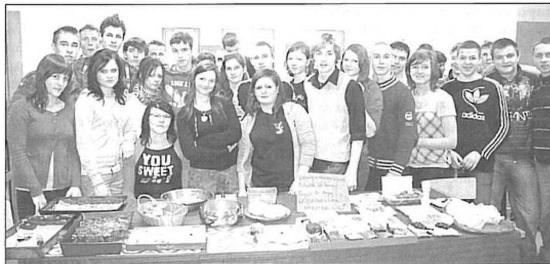
Licealiści z Pawłowic bardzo chętnie biorą udział w akcji mającej na celu zbiórkę pieniędzy dla 10-letniej dziewczynki z Ruandy.