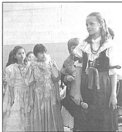
Spektakl „Kopciuszek po śląsku” spodobał się publiczności.

Jak widać, takie imprezy są potrzebne, a zapoznanie dzieci z kulturą regionu, kształtuje poczucie przynależności do społeczności śląskiej. bs