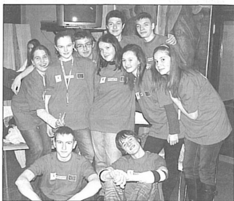
W projekcie brało udział 40 osób w wieku od 13 do 15 lat.

W projekcie realizowanym przez Gimnazjum nr 2 w Pawłowicach i Zespół Szkół w Tepliczce brało udział 40 osób w wieku od 13 do 15 lat: po 20 z każdej miejscowości. Oprócz lekcji na torze curlingowym, młodzież w ramach projektu uczestniczyła w zajęciach integracyjnych, które miały służyć lepszemu poznaniu się, a także brała udział w warsztatach, podczas których dowiadywała się jak najwięcej informacji o swoich miastach partnerskich. Odbyła się również wycieczka do Pszczyny, bieg na orientację po ciekawych miejscach naszej gminy, a także wieczorki polski i słowacki, i na koniec międzynarodowe zawody gry w curling, będące sprawdzianem zdobytej wiedzy i nowo nabytych umiejętności. I trzeba przyznać, że nauka nie poszła na marne, a cztery dni nauki dały efekt. Obydwie reprezentacje radziły sobie znakomicie.