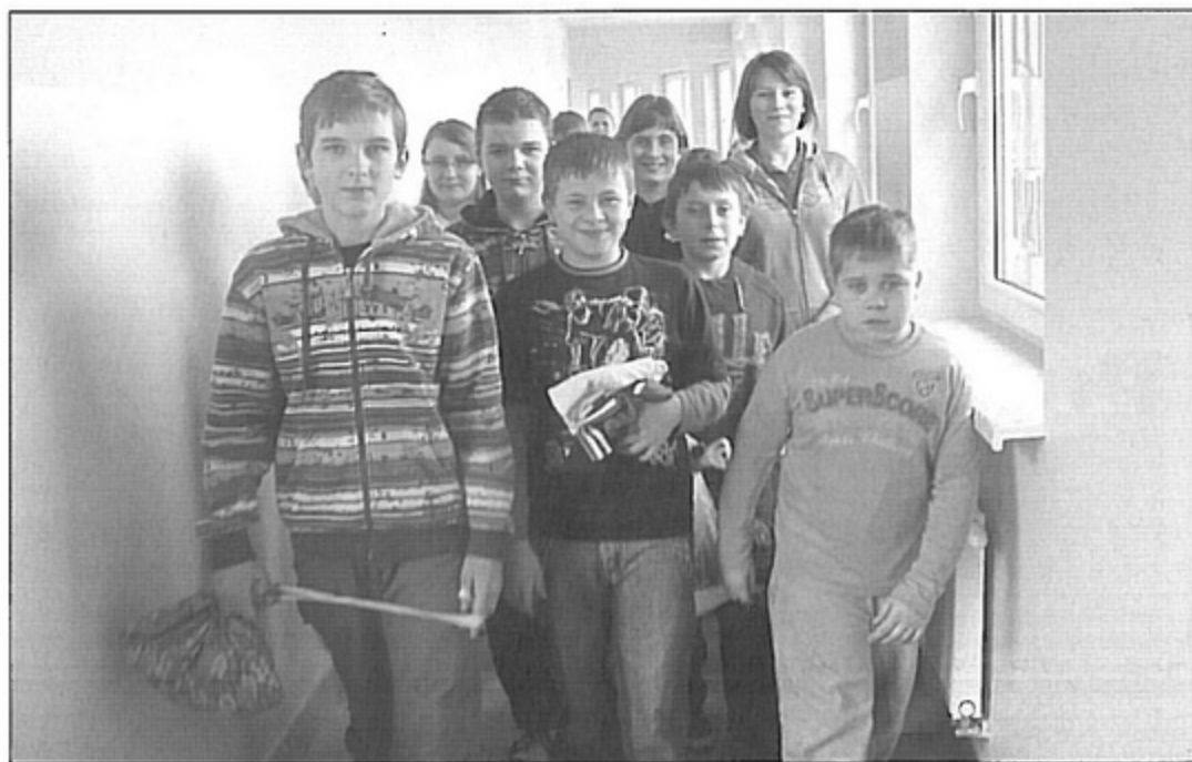
Szóstoklasiści w drodze na lekcje gimnastyki.

Wcześniej jednak, przez wiele lat, niezależnie od panującej na zewnątrz aury, dzieci zakładały kurtki i buty i udawały się na gimnastykę. Później już po zajęciach, zgrzane, wracały do szkoły. Było to nie tylko niewygodne, czasochłonne, ale i niekorzystne dla zdrowia. Dobrze więc, że gmina postanowiła wybudować łącznik, który scalil oddalone od siebie części. Przy okazji prowadzonych robót postanowiono również rozwiązać inne problemy. Przede wszystkim przeniesiono do wybudowanej części bibliotekę. Przez wiele lat znajdowała się ona w małym pomiesz-