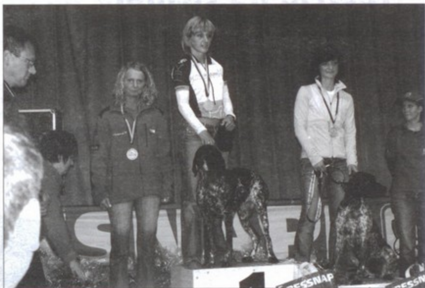
Pawłowiczanka na podium Mistrzostw Świata.

Sezon zawodów zaczyna się we wrześniu i trwa aż do marca. Mieszkanka Pawłowic jest dwukrotną Mistrzynią Polski w tej dyscyplinie sportowej w 2006 i 2007 roku. Pisaliśmy