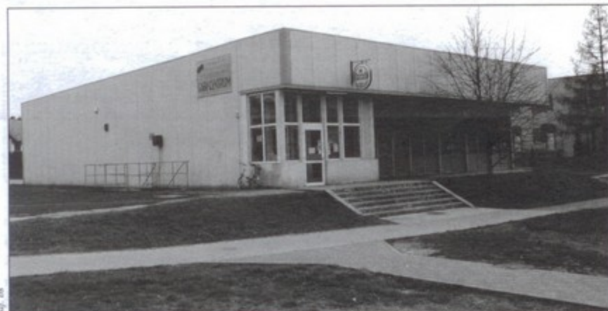
W pawilonie GABI-CENTRUM będzie się znajdować nowa siedziba spółdzielni.