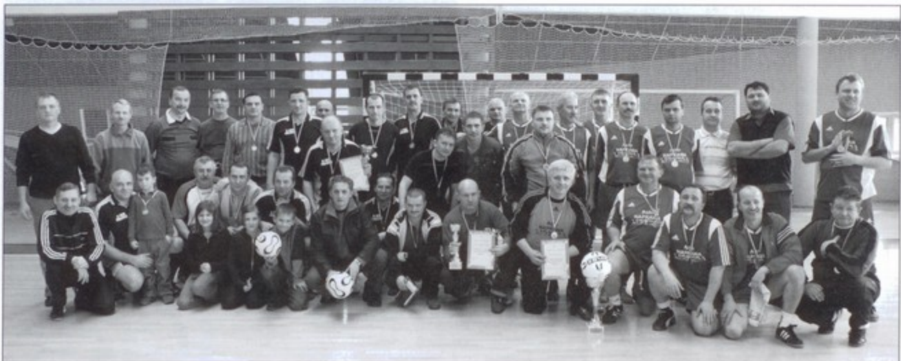
Pamiątkowe zdjęcie wszystkich uczestników piłkarskich zmagania.