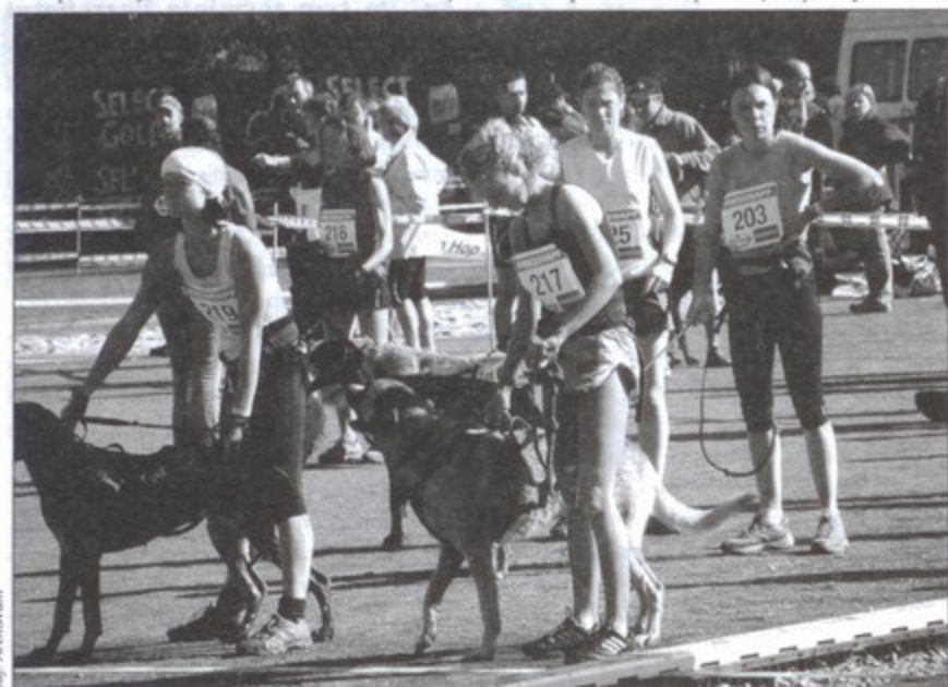
Kilka minut przed startem w wyścigach Eurocanicross 2007 w Niemczech.