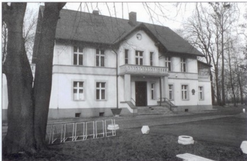
Budynek Reizensteinów ma być zaadaptowany na dom dziennego pobytu dla osób starszych.

Realizacja inwestycji nastąpi w 2009 i 2010 roku. bs