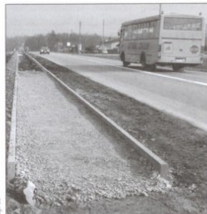
Do końca maja mieszkańcy Pawłowic i Golasowic będą mogli poruszać się po nowym chodniku.