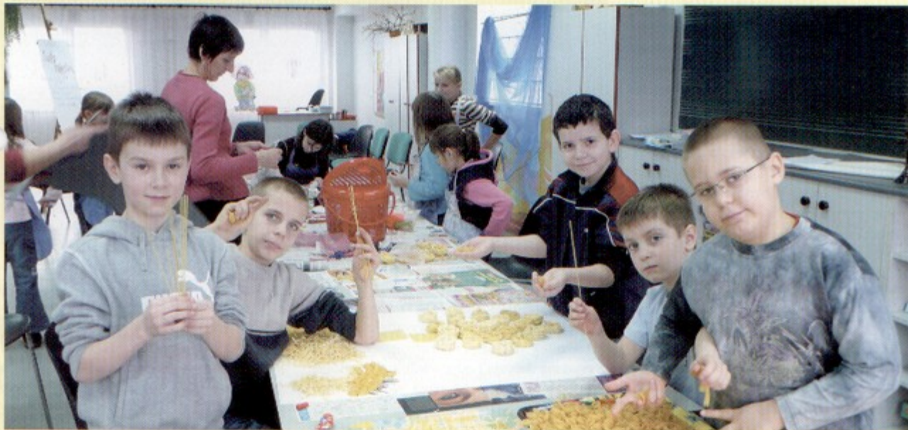
Uczestnicy zajęć organizowanych w Osiedlowym Domu Kultury w czasie "Święta Makaronu".

Bez śniegu, ale na pewno nie nudno minęły tegoroczne ferie organizowane dla dzieci przez placówki kulturalne naszej gminy.