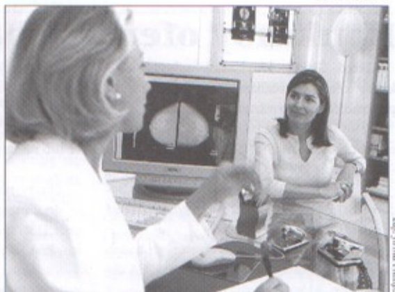
W ubiegłym roku przebadano się 225 mieszkank naszej gminy.