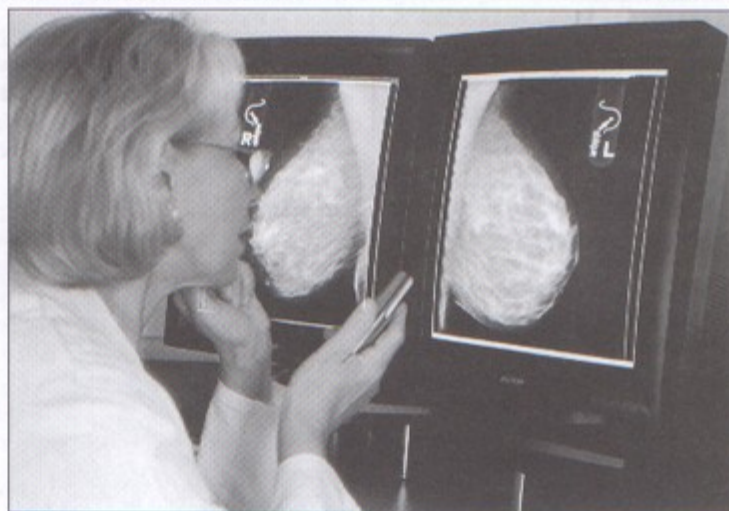
Nikt nie może mieć stuprocentowej pewności, że nie zachoruje na raka. Dlatego tak ważne są profilaktyczne badania.