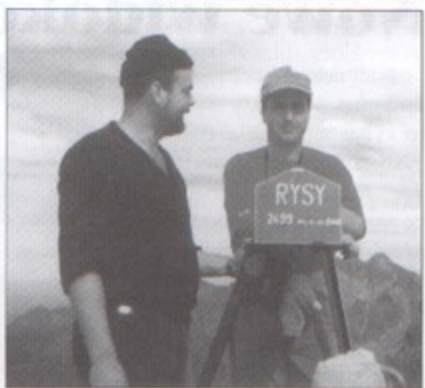
Zdobywcy szczytu (radny - pierwszy z prawej).