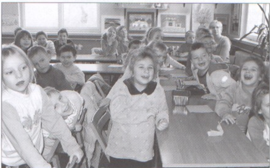
Uśmiech i radość przedszkolaków to najlepszy dowód na to, że spotkania w bibliotece mają sens.

Celem spotkań organizowanych przez Gminną Bibliotekę Publiczną jest wzbudzenie miłości do literatury poprzez wspólne czytanie książek oraz zabawę. – Nie od dziś wiadomo, że czytanie książek rozwija wyobraźnię i kształtuje wrażliwość na otaczający świat. Zdajemy sobie sprawę z tego, że osoby, które sięgają po książkę, będąc jeszcze dzieckiem, robią to także w wieku dorosłym, dlatego chcemy zaszczerpić w tym młodym pokoleniu nawyk sięgania po literaturę i zachęcić do ko-