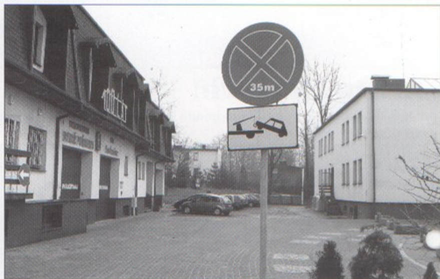
Na placu przy Urzędzie Gminy można parkować tylko w wyznaczonych miejscach. Zakaz zatrzymywania wprowadzono przy strażnicy.