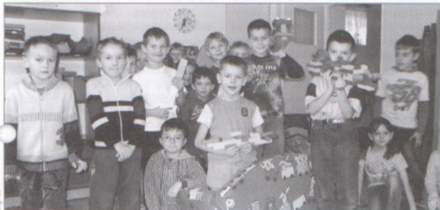
Grupa sześciolatków z przedszkola w Warszawicach.