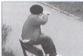
Za picie alkoholu w miejscu publicznym, ten młody mężczyzna zapłacił mandat.

W przyszłości monitoringiem mają być objęte inne tereny gminy. bs