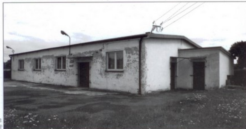
Dawna świetlica w Jarząbkowicach zostanie przebudowana na mieszkania socjalne.

Oddanie nowego budynku z pewnością nie rozwiąże całkowicie problemu braku mieszkań socjalnych. Ich ilość wciąż jest niewystarczająca. Dlatego w następnych latach gmina planuje budowę lokali socjalnych w systemie kontenerowym. Będą to mieszkania o obniżonym standardzie, do których będą trafiały osoby zalegające z opłatami czynszowymi. Kontenery będą jednoizbowe z oddzielnym wspólnym węzłem sanitarnym i kuchennym. bs