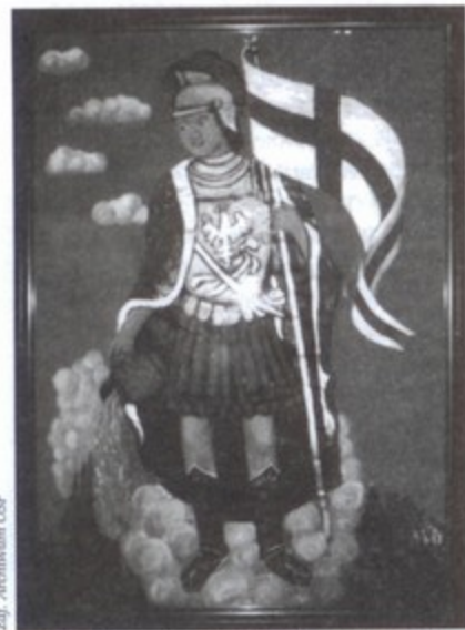
Oryginalny obraz św. Floriana znów zdobi budynek Domu Strażaka.

Niezwykła historia obrazu św. Floriana w Ochotniczej Straży Pożarnej w Pielgrzymowicach.