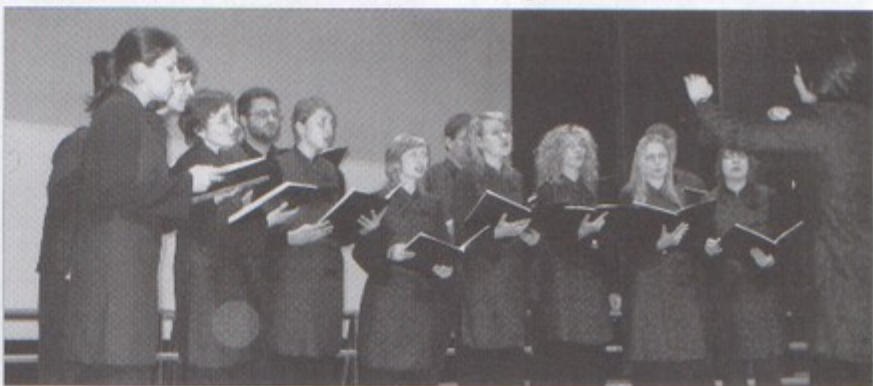
Chór Animato podczas występu.

te zespół przeznaczy na pokrycie kosztów wyjazdu na Festiwal Chóralny w Namestovie w Słowacji, który odbędzie się w maju bieżącego roku. bs