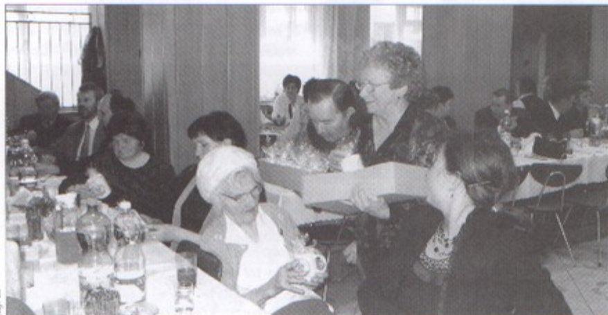
Pamiątkowe kubki z okolicznościowym napisem otrzymały wszystkie członkinie KGW.