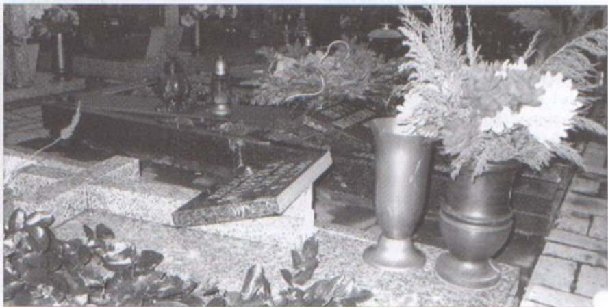
Dewastacja cmentarza to dla mieszkańców gminy prawdziwy wstrząs.

Policja zwraca się z apelem do wszystkich osób, które cokolwiek wiedzą o tym zdarzeniu, o kontakt z policją. Nie trzeba podawać swoich danych, może to być informacja złożona anonimowo poprzez telefon lub stronę internetową policji: www.pawlowice.policja.katowice.pl . bs