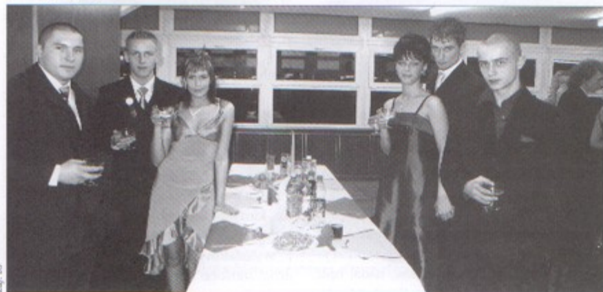
W hali zbornej bawiło się 216 młodych osób.

Na studniówkę czeka się właściwie od pierwszej klasy szkoły średniej. Kojarzy się z dorosłością, piękną suknią, wytwornością. Jedyna noc, jedyny bal w swoim rodzaju.