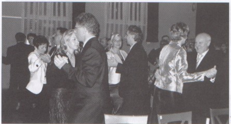
Przedsiębiorcy z Pawłowic w trakcie zabawy.