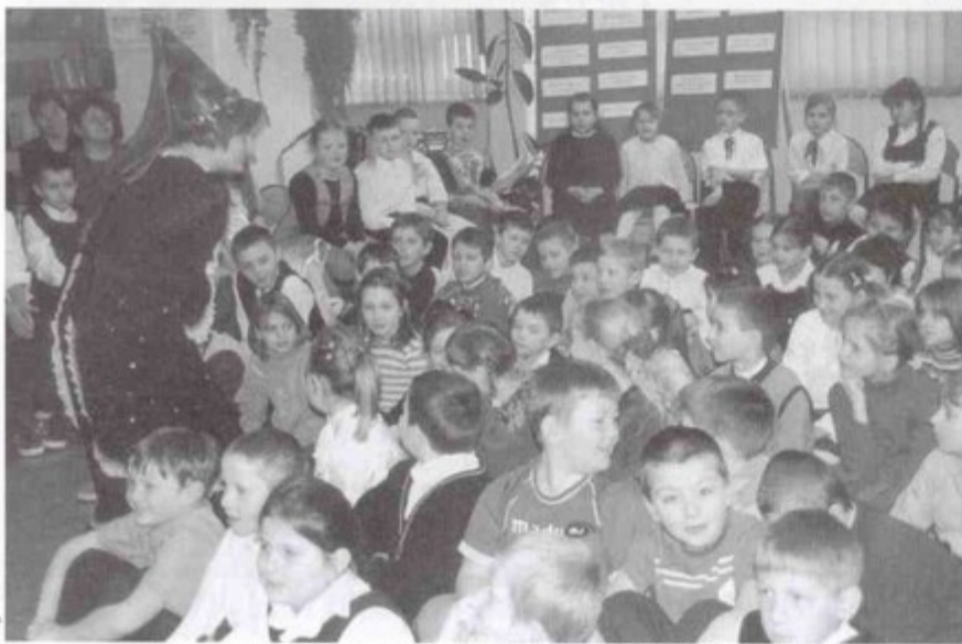
Z pisarką spotkali się m.in. uczniowie drugich i trzecich klas SP-1 w Pawłowicach.

Książki dla dzieci pisze od 10 lat, ale zadebiutowała dopiero cztery lata temu "Zaczarowaną krainą bajek". Dwa lata później spod jej pióra wyszła biografia Hansa Chry-