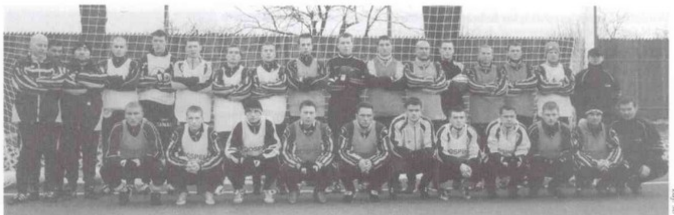
Piłkarze i trenerzy GKS Dospel Katowice.

tutejszych obiektów sportowych. Obiecują również, że w Pawłowicach rozegrają jedno z towarzyskich spotkań (z innym pierwszoligowym klubem lub klubem zagranicznym).