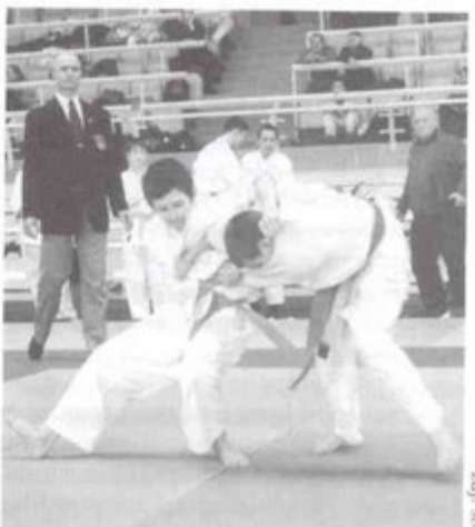
W turnieju zmierzyło się 150 najlepszych zawodników woj. śląskiego i opolskiego.

Ostatecznie pawłowiczanie zajęli piąte miejsce i zdobyli pierwsze punkty w klasyfikacji ogólnej. Miał jednak szanse na miejsce na podium, ale w walce o trzecie miejsce uległ nieznacznie Andrzejowi Klimasow.