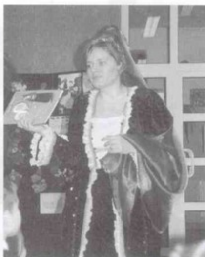
Autorka na spotkaniu z czytelnikami przebiera się za wróżkę.

stiana Andersena. W roku 2003 ukazało się aż pięć książek jej autorstwa: "Zaczarowa-