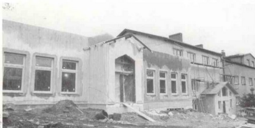
Robotników nie widać, bo prace prowadzone są wewnątrz obiektu.