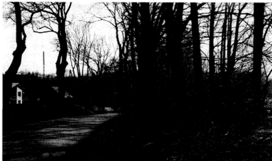
Teraz trzeba jeszcze pozierać gałęzie

Ponadto zwycięzca konkursu, jego wypiek i przepis zostaną zaprezentowane w "Racjach Gminnych".