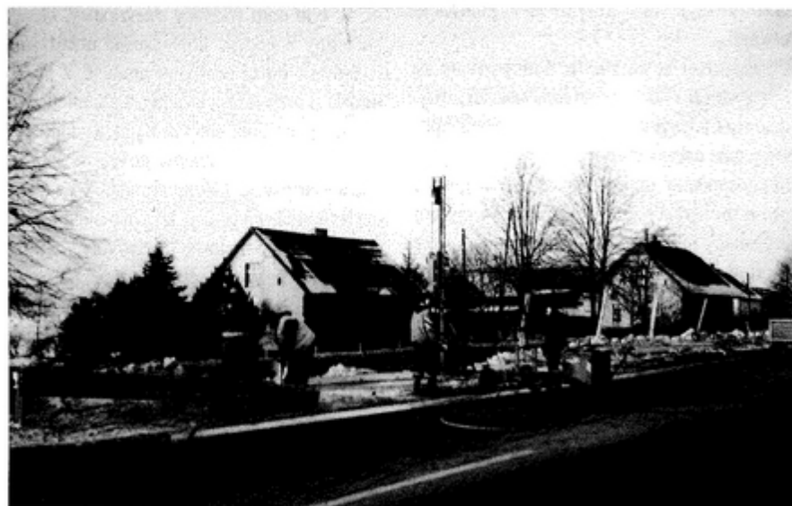
Metalowe barierki zostały zamontowane w styczniu br.

Montaż metalowych barierek energochłonnych rozpoczął się w połowie stycznia br. O ich ustawieniu zdecydowały, zdaniem Generalnej Dyrekcji Dróg Publicznych, względy bezpieczeństwa. Barierki zostały ustawione na odcinku jednego kilometra, na łuku poprzedzającym skrzyżowanie dróg prowadzących do centrum gminy oraz w kierunku Warszowic. - Na pewno przyczynią się one do poprawy bezpieczeństwa na tym odcinku. Zwłaszcza, że doszło tam już do kilku wypadków z udziałem pieszych - usłyszeliśmy w Generalnej Dyrekcji Dróg Publicznych