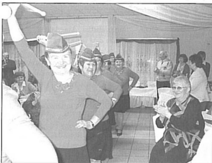
„Druga Młodość” z Szerokiej zachwycała publiczność.

Na zakończenie spotkania w kilkudziesięciominutowym programie wystąpiła grupa „Druga Młodość” z Szerokiej. Liczne grono mieszkańców Pniówka najpierw usłyszało kolędy w ich wykonaniu, a następnie zabawne skecze, podczas których członkowie zespołu przebierali się za niedźwiadki, pszczołki i inne postaci, śpiewając odpowiednie do tego piosenki. Publiczność dosłownie pękała ze śmiechu. bs