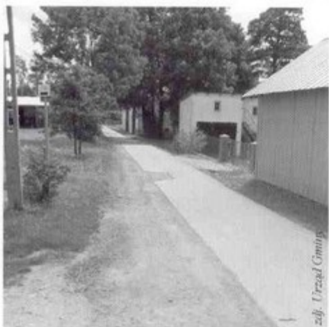
Ulica Kościuszki przed remontem.

pozytywna opinia z kontroli nie wystarczyła do zamknięcia sprawy. Po nagłej