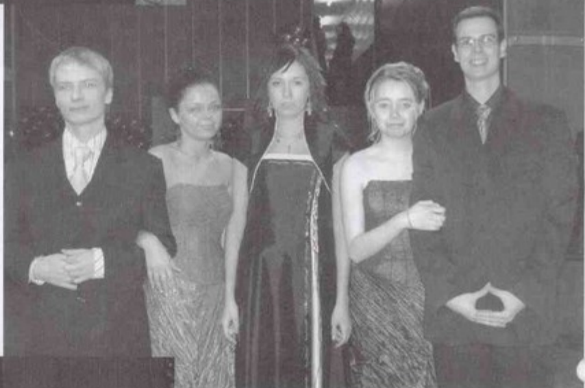
Pamiątkowe zdjęcie uczestników studniówki.

W minioną sobotę odbyła się studniówka maturzystów Zespołu Szkół Ogólnokształcących w Pawłowicach. W hali zbornej przy kopalni bawiono się 181 uczniów. Po oficjalnym przywitaniu i tradycyjnym odtańczeniu poloneza, rozpo-