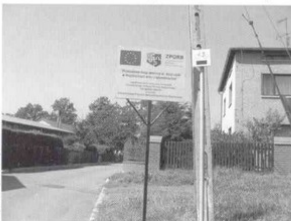
Tablica informacyjna przy przebudowanej drodze.

przystąpiono do sporządzania aneksu do umowy, bo w tym czasie inwestycja była już zrealizowana. Znowu w ruch poszły telefony, wysyłki dokumentów i konsultacje. Byliśmy i tak w komfortowej sytuacji,