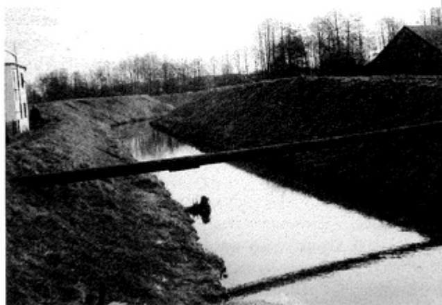
Obwałowanie Pszczynki, zdaniem mieszkańców, podzieliło wieś na dwie części