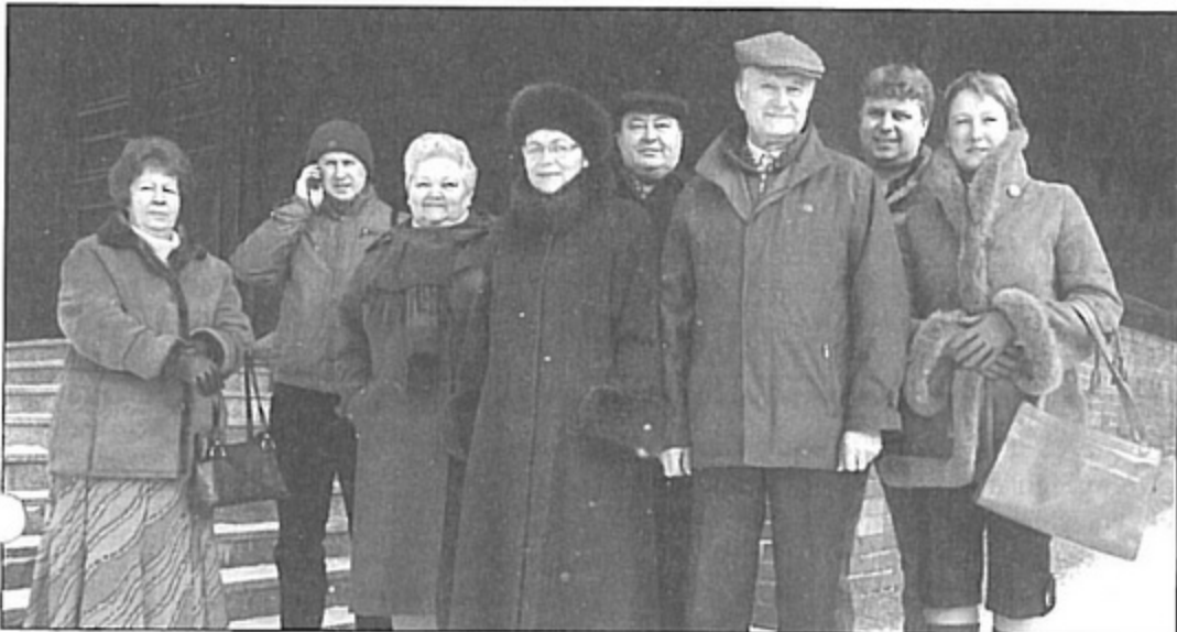
Starostowie gmin Dobra, Dobratice oraz Raskovice z członkami stowarzyszenia z Pielgrzymowic.