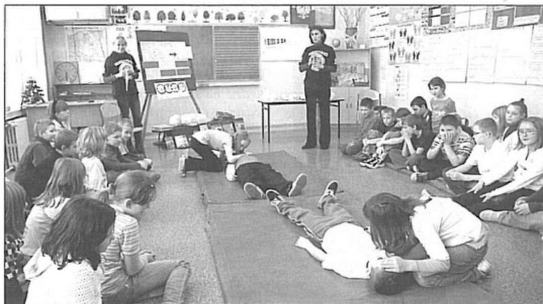
W czasie kursu każdy uczeń musiał samodzielnie przeprowadzić reanimację.

Program „Ratujemy i Uczymy się Ratować” WOŚP został uruchomiony w 2006 roku. Od tego czasu Fundacja przeszkoliła ponad 17 tys. nauczycieli z ponad 9 tys.