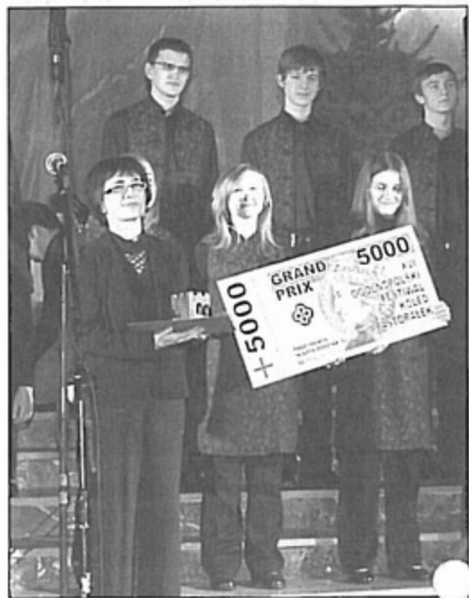
Nagrodą za Grand Prix było 5000 zł.

Nasi mieszkańcy będą mieli okazję posłuchać hanowerskiego chóru w październiku. Ma on złożyć rewizytę i będzie występował przed pawłowicką publicznością. Natomiast