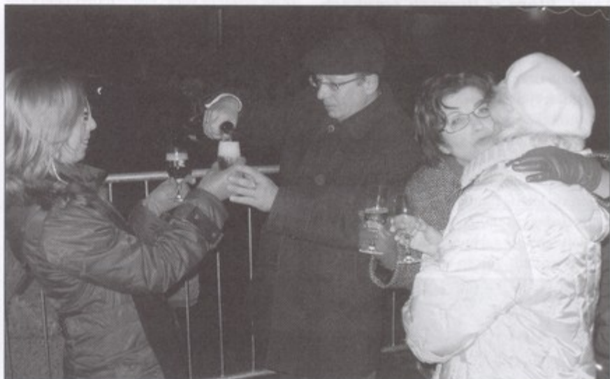
Już po raz drugi mieszkańcy naszej gminy witali Nowy Rok na pawłowickim rynku.