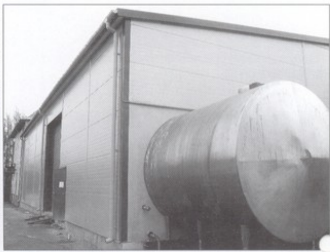
Pawłowicka mleczarnia jako jedyny zakład spożywczy w powiecie pszczyńskim może się pochwalić certyfikatem ISO 22000:2005. To nowa norma brytyjska systemów zarządzania bezpieczeństwem żywności.

ści 15 tys. litrów na godzinę. Natomiast w celu obniżenia wydatków związanych z funkcjonowaniem zakładu, oddział zostanie podłączony do sieci ciepłowniczej Spółki Energetycznej Jastrzębie. Trafiająca tu ciepła woda będzie wykorzystywana do