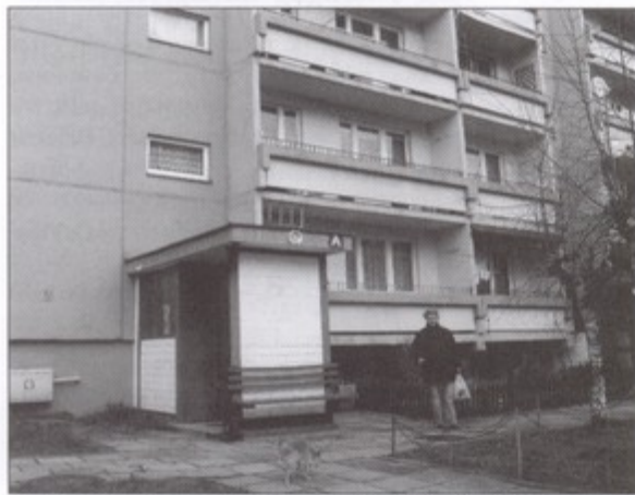
Jest taki blok - 26A - w którym sąsiedzi służą sobie pomocą na wiele różnych sposobów.

Sąsiedztwa, w jakim przychodzi nam mieszkać, zazwyczaj się nie wybiera. Bywa tak, że mieszkańcy jednej klatki schodowej, nie mówiąc już o całym budynku, nie znają się nawzajem. Są anonimowi. Owszem, zwykle się tolerują, ale nie zawsze się lubią.