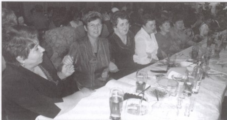
Biesiadnicy szybko włączyli się do wspólnej zabawy.

Przy żeberkach, krupnioku i słynnych śląskich kołaczach oraz atrakcyjnym programie artystycznym czas biegł szybko i ani się nie obejrzano, gdy o północy trzeba było zakończyć zabawę. Następną już za rok! bs