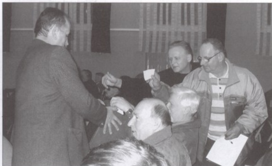
W wyborach rady sołectwej Pawłowic uczestniczyło ponad dziewięćdziesiątu mieszkańców.

Największe zmiany i najwyższa frekwencja w Pielgrzymowicach. Po starym w Pawłowicach i Pniówku. Rozpoczęły się coroczne zebrania sprawozdawcze w sołectwach. W tym roku mają one szczególny charakter, gdyż w związku z upływem czteroletniej kadencji wybierani są sołtysy oraz członkowie rad sołeckich.