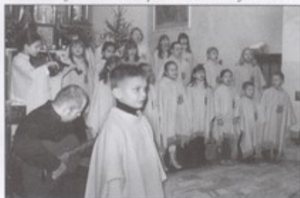
Koncert scholi parafialnej

W Warszowicach przez godzinę publiczność zgromadzona w kościele mogła podziwiać znakomite wykonanie muzyki góralskiej niejednokrotnie przedstawionej w nowych aranżacjach. bs