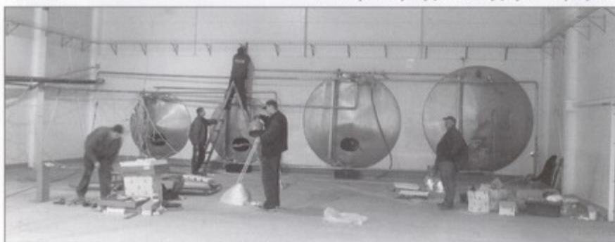
Na finiszu jest budowa nowego magazynu mleczarni.