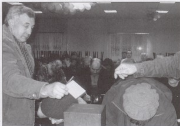
Pięćdziesięciu sześciu mieszkańców Pniówka głosowało na obecnego sołtysa.