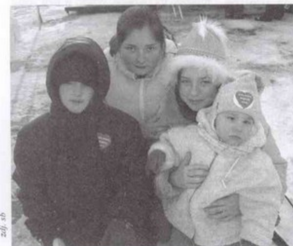
Uczestnicy pawłowickiego finału WOŚP.