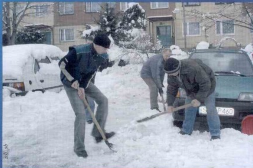
Żeby wyjechać samochodem, najpierw trzeba odśnieżyć. W takich sytuacjach przydaje się pomoc sąsiadów.