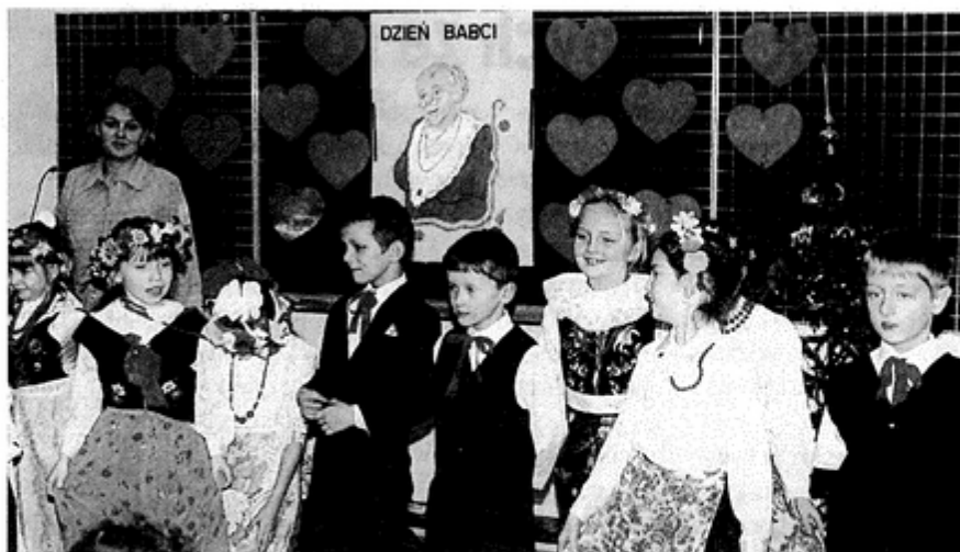
Dzieci pięknie zaprezentowały się przed swoimi babciami

Tekst i zdjęcia Danuta Brandys - wychowawczyni kl. Ib