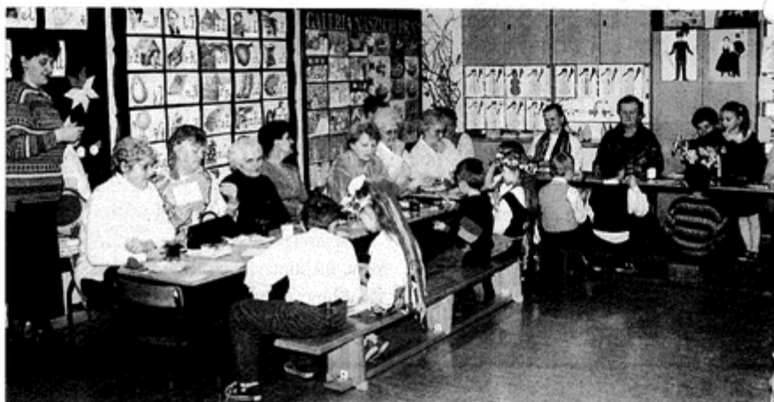
Nie zapomniano i o laurkach, pełnych życzeń i słów miłości

Pierwszy etap budowy kanalizacji sanitarnej Pawłowice Centrum z podłączeniem do sieci 50 domów, został zrealizowany do końca grudnia 2001 r.