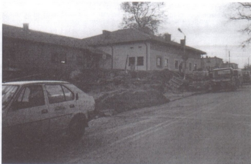
Dom Ludowy w czasie prac wykończeniowych

Dynamiczny rozwój Pawłowic! Inwestycyjny boom!