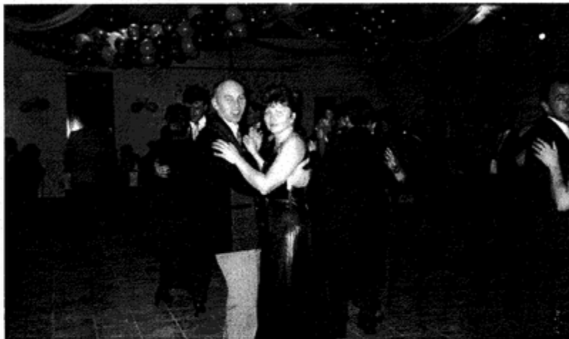
Sylwester w Domu Ludowym

Drodzy mieszkańcy Jarząbkowic - czytelnicy Racji Gminnych, ten dom to wasz sukces i wasza duma. Z wami cieszy się cała gmina. Niech ten obiekt służy nam wszystkim długie lata a prowadzona działalność promienieje na całą okolicę.