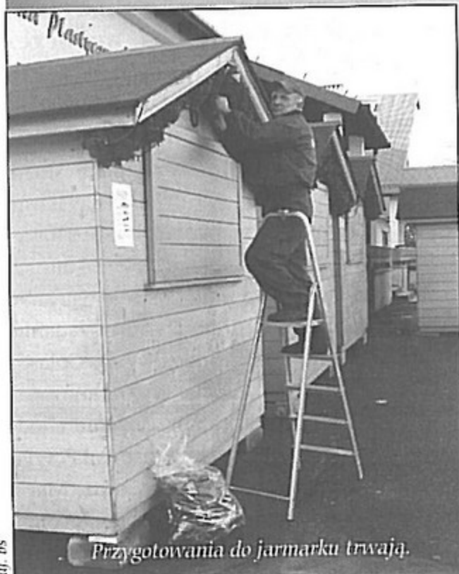
Przygotowania do jarmarku trwają.

Spotkajmy się przy Gminnym Ośrodku Kultury w Pawłowicach w świątecznym klimacie - zachęcają organizatorzy Jarmarku Bożonarodzeniowego, który rozpocznie się w niedzielę (18 grudnia) i potrwa do 23 grudnia.