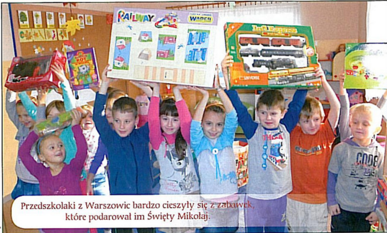
Przedsiębiorcy z Warszawy bardzo cieszyli się z zabawek, które podarował im Święty Mikołaj.

- Ale super! - krzyczały dzieci otwierając prezenty, które podarował im Święty Mikołaj.