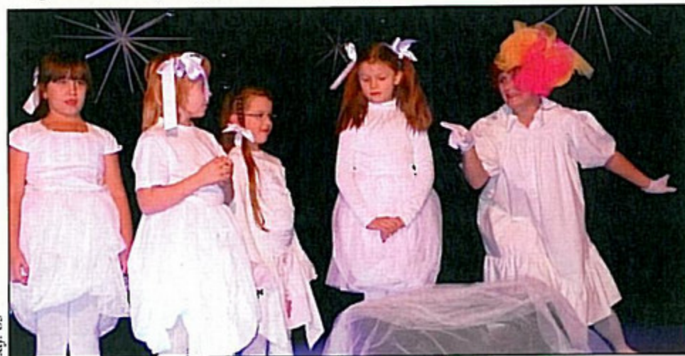
Podczas mikołajkowego spotkania wystąpił m.in. Teatr Ruchu i Animacji "TRiA" z GOK Pawłowice.

Święta bez Mikołaja? O nie! Mikołaj jest ważną postacią i sprawia, że święta są magiczne. Staruszek w czerwonym kubraczku to najbardziej wyczekiwany przez wszystkie dzieci jegomość.