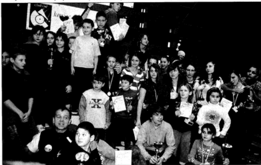
Najlepsi zawodnicy rozgrywek finałowych Pucharu UKS.