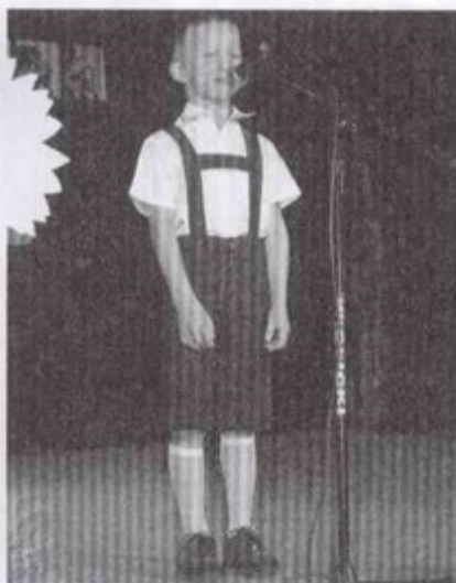
Uczniowie klas trzecich w trakcie występu.