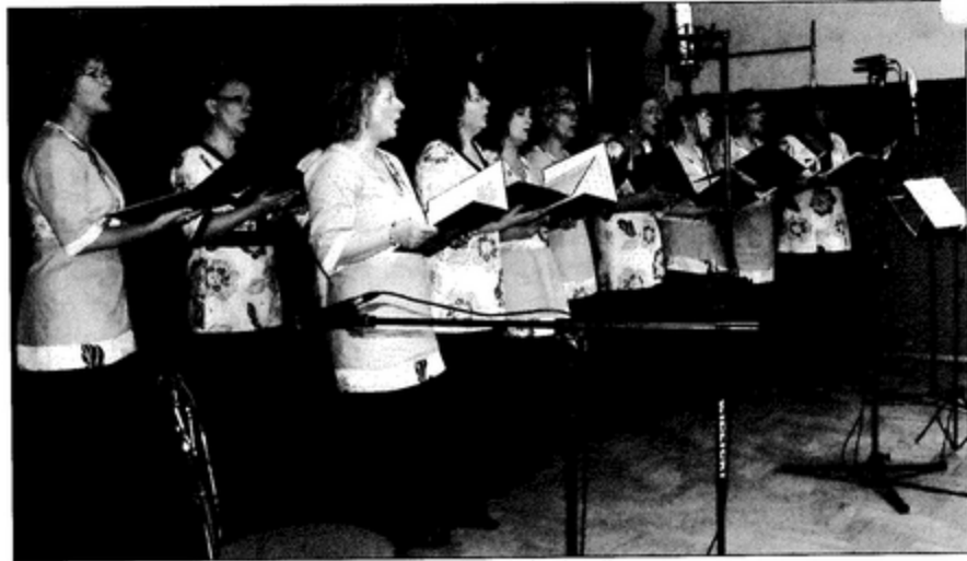
Zespół „Margo” był gospodarzem tegorocznej „Cecyliady”.