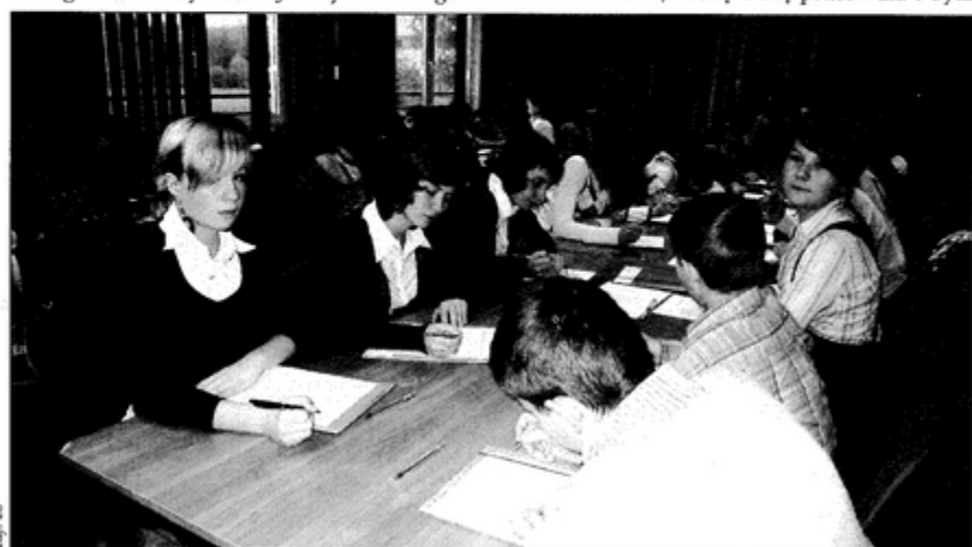
Z tekstem tegorocznego dyktanda zmierzyło się ponad osiemdziesiąt osób.