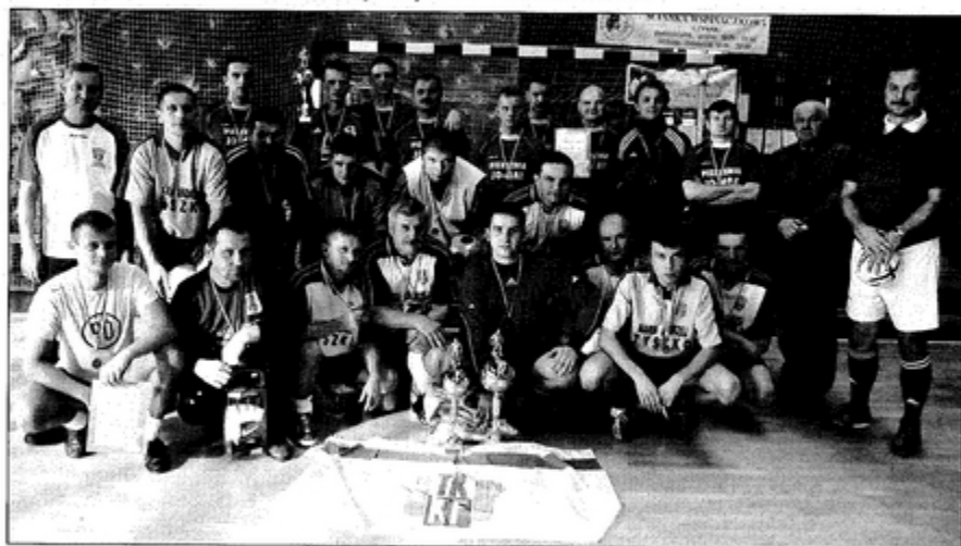
Najlepsze drużyny turnieju.