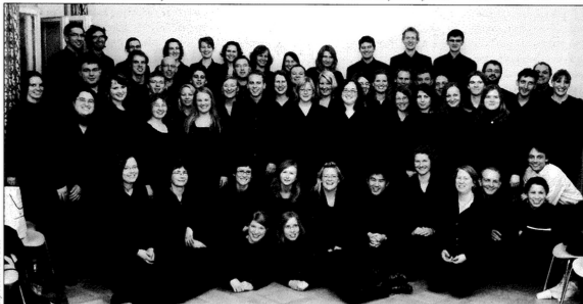
Pamiątkowe zdjęcie chórzystów z Pawłowic z członkami niemieckiego chóru „Clazz”.