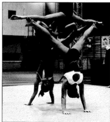
Grupa akrobatyczna z Katowic.

Zwyciężyła przedstawicielka grupy akrobatycznej z Katowic.