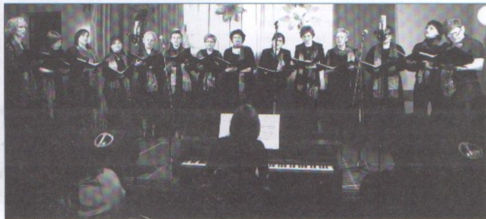
Swoim występem zespół „Margo” z Pawłowic sprawił wielką radość słuchaczom.