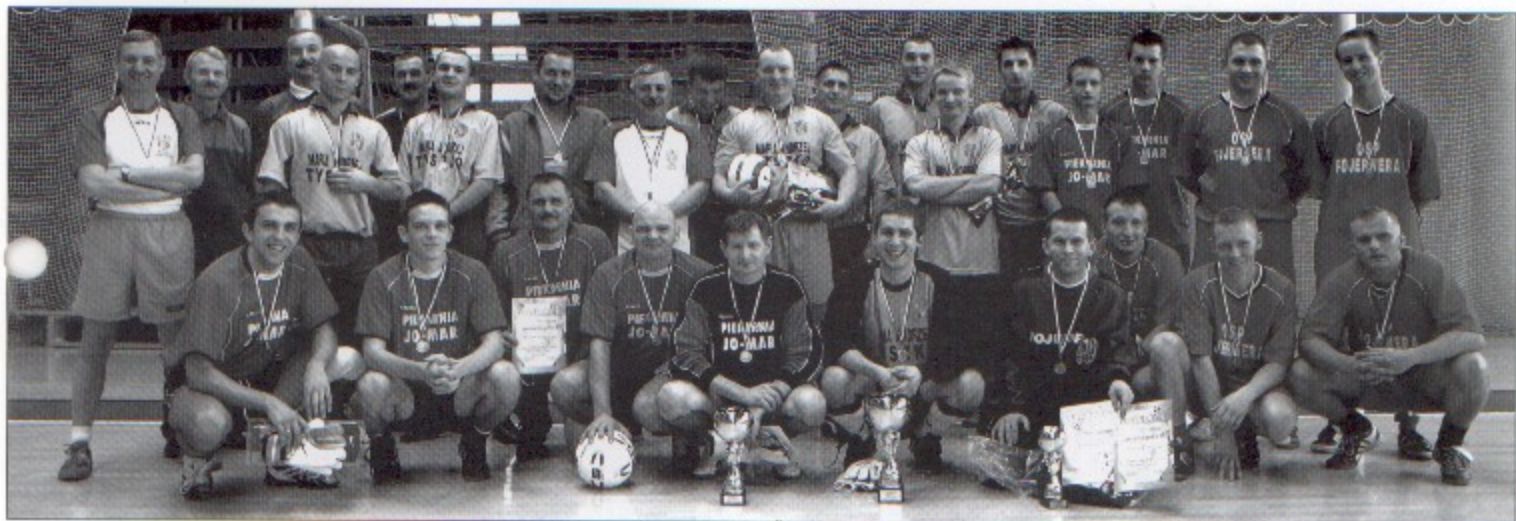
Trzy najlepsze drużyny halowych zmaganiach.