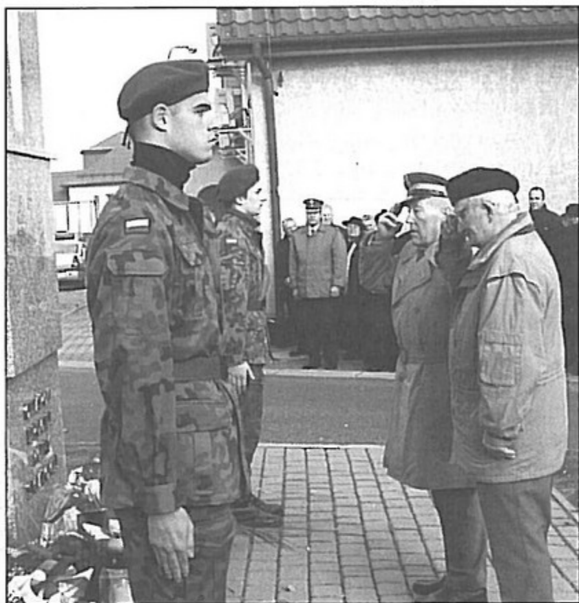
Hold ofiarom II Wojny Światowej oddają kombataneci.

W dniu szczególnie upamiętnianym najważniejsze święto narodowe, jakim jest rocznica odzyskania przez Polskę niepodległości, przyznano wyróżnienia zasłużonym mieszkańcom oraz organizacjom, które wybitnie przyczyniły się do