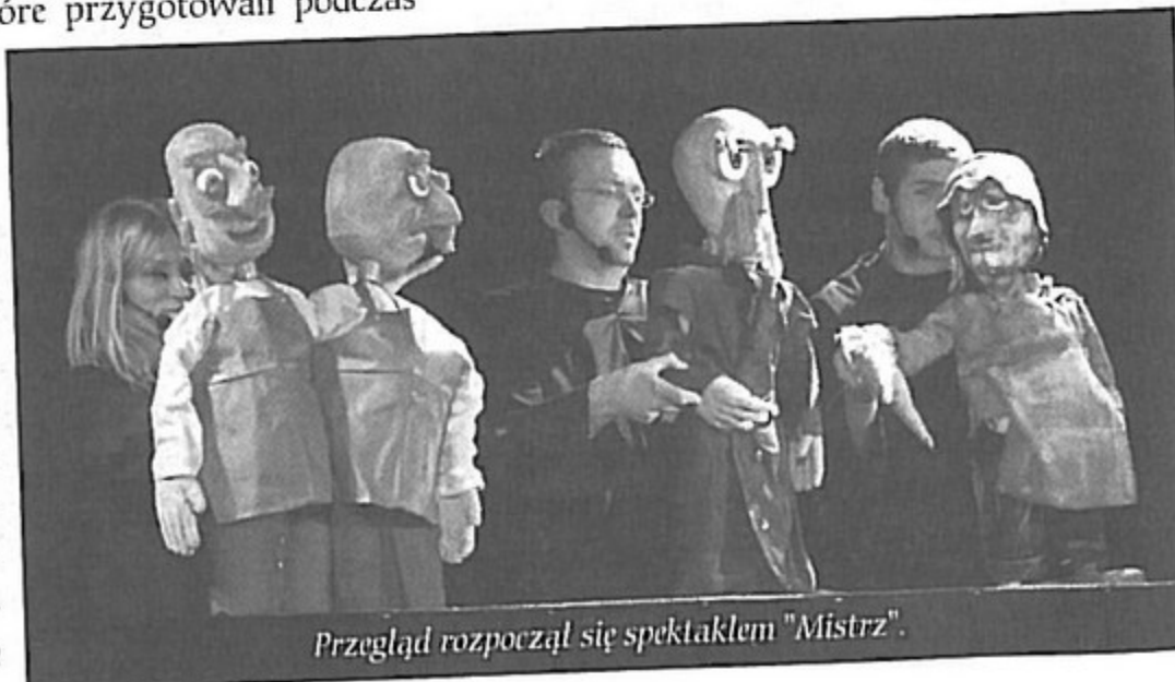
Przeгляд rozpoczął się spektaklem „Mistrz”.