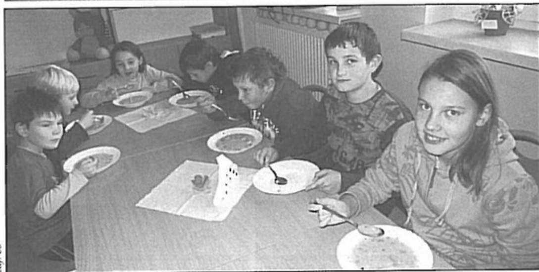
Uczniowie z Krzyżowic z apetytem jedzą obiady, które gotuje dla nich kuchnia SP 2 Pawłowice.

- Porcje są większe, a jedzenie jest pyszne. Smakuje jak w domu - chwalą uczniowie z Krzyżowic i Warszowic.