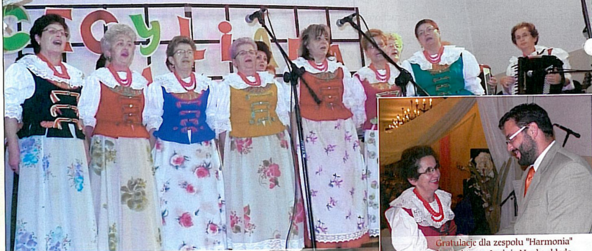
Gospodarzem tegorocznej „Cecyliady” był zespół „Harmonia” z Krzyżowic. O imprezie czytaj na stronie 6.