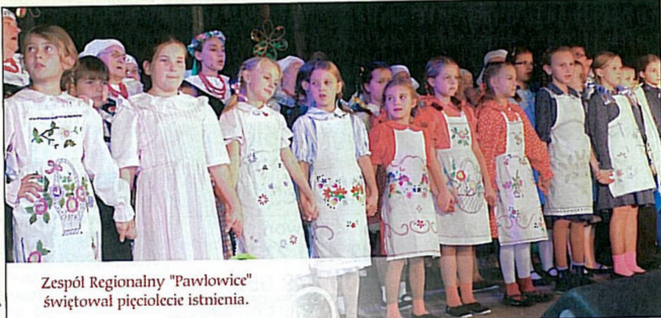
Zespół Regionalny „Pawłowice” świętował pięciolecie istnienia.

– Od tego czasu wiele się zmieniło. Mamy nowy repertuar, inne osoby należą też do naszego zespołu, chociaż wiele z nami zostało.