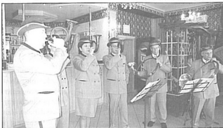
Rogi sygnalistów Echa Pszczyny grzmiały zarówno w kościele, jak i podczas oficjalnej uroczystości.

zacje i spory o obwody łowieckie, spowodowały zupełną zmianę terenu. Koło zmieniło nazwę i siedzibę. Dziś "Remiza" Pawłowice ma do swojej dyspozycji obszar 4 tys. ha gruntów polnych i leśnych, które znajdują się w czterech gminach: Pawłowicach, Jastrzębiu, Zebrzydowicach i Strumieniu. Niewtajemniczonym wyjaśnijmy, że nazwa „Remiza” nie jest związana ze strażakami, ale jest