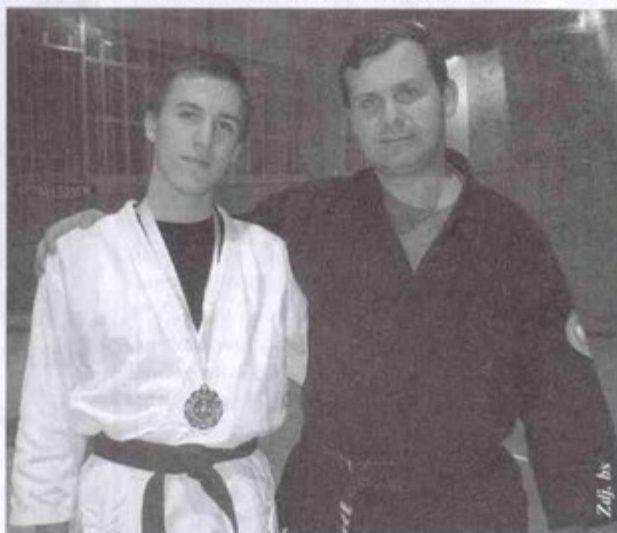
Mistrz i jego trener.