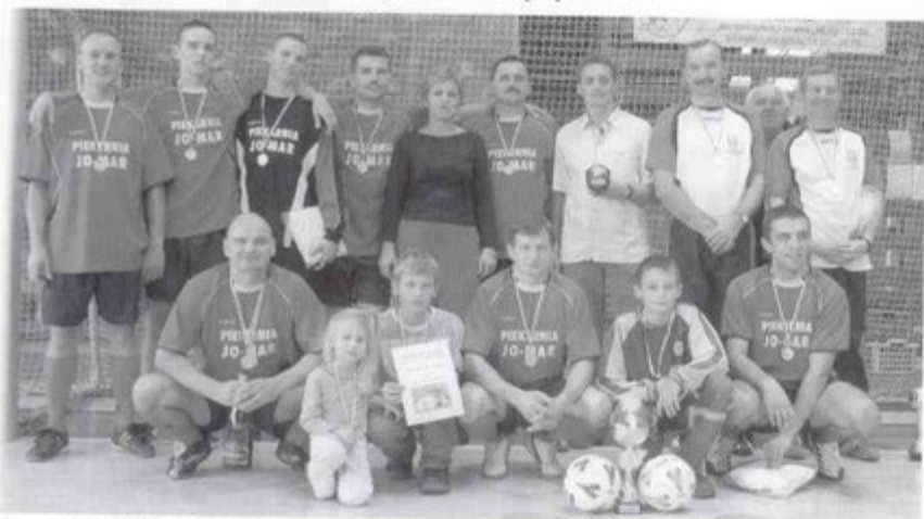
Drużyna JO-MAR Stawowa, zwycięzcy Gminnej Ligi Piłki Nożnej Amatorów.