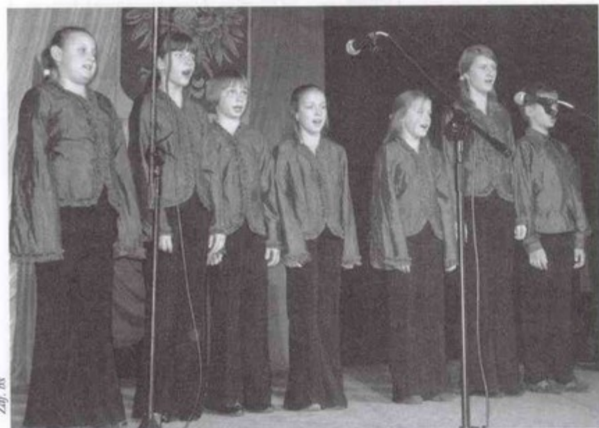
Średnia grupa „Miniatury” w czasie występu.

Uroczystą akademię uświetniły występy uczniów ze Szkoły Podstawowej nr 2 w Pawłowicach przygotowane przez Barbarę Baron i Iwonę Duszę oraz chóru Animato i zespołu Miniatura. bs