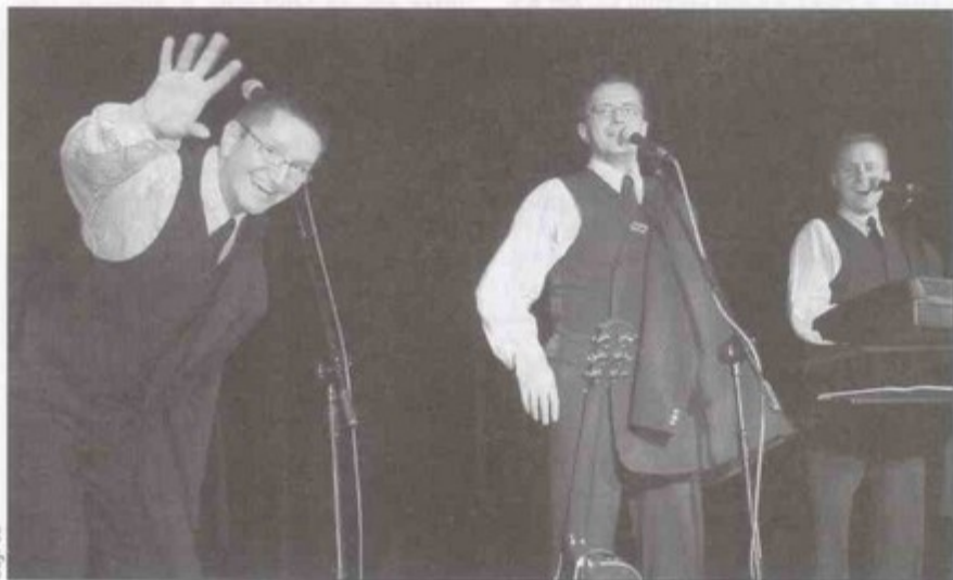
Członkowie kabaretu OT:TO to profesjonaliści. Wiedzą jak pozować do zdjęcia.