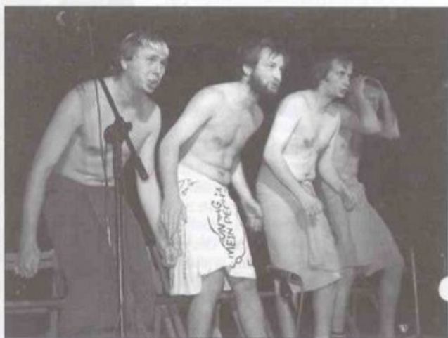
Lowcy.B w pełnej krasie.