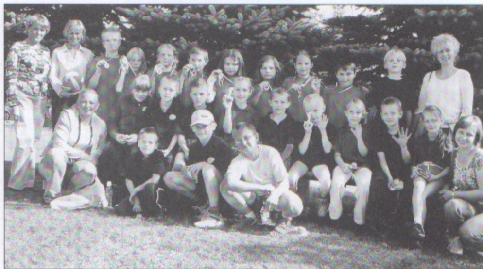
Uczniowie Zespołu Szkolno-Przedszkolnego w Golasowicach.

Następne spotkanie planowane jest wiosną 2008 roku w Zespole Szkolno-Przedszkolnym w Golasowicach. Mamy nadzieję, że będzie równie udane jak to w Ropicach. ZSP Golasowice