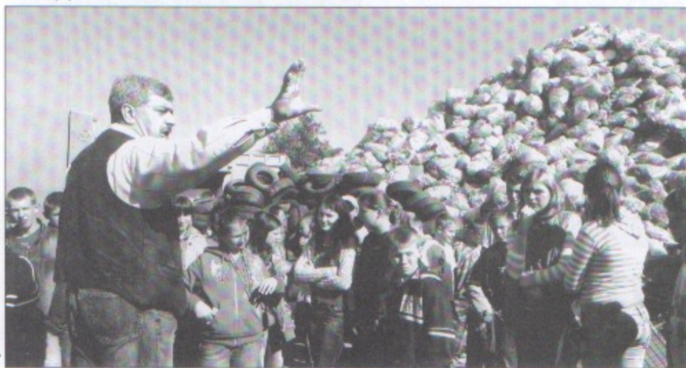
Uczniowie z Pielgrzymowic w czasie wizyty w składnicy odpadów.