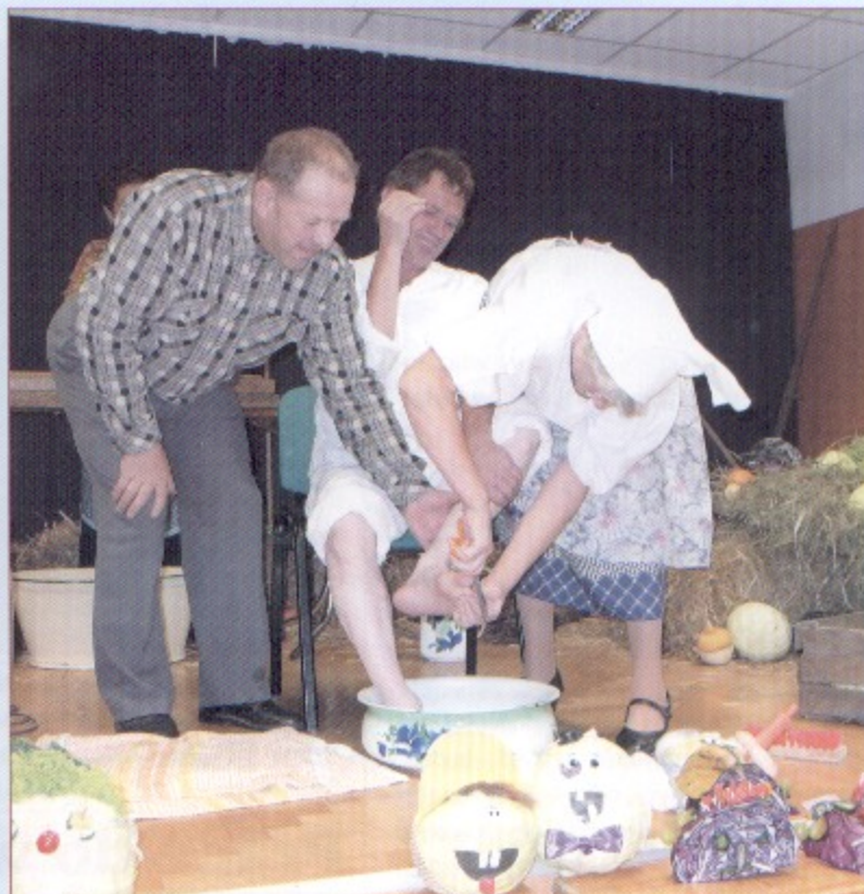
Obrzęd kisenia kapusty w wykonaniu zespołu z Osin.