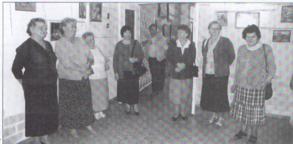
Autorka wystawy (pierwsza z lewej) w czasie wernisażu.