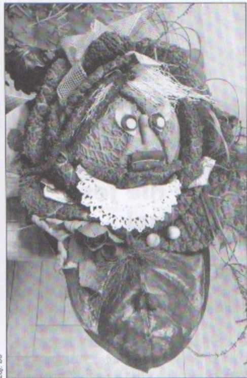
Jedna z prac zgłoszonych na konkurs "Nadaj kapuście twarz".

Chyba trochę zapomnieliśmy o kapuście. Tej zwykłej kapuście, o której medycyna ludowa już od dawna wiedziała, że to prawdziwy skarb.