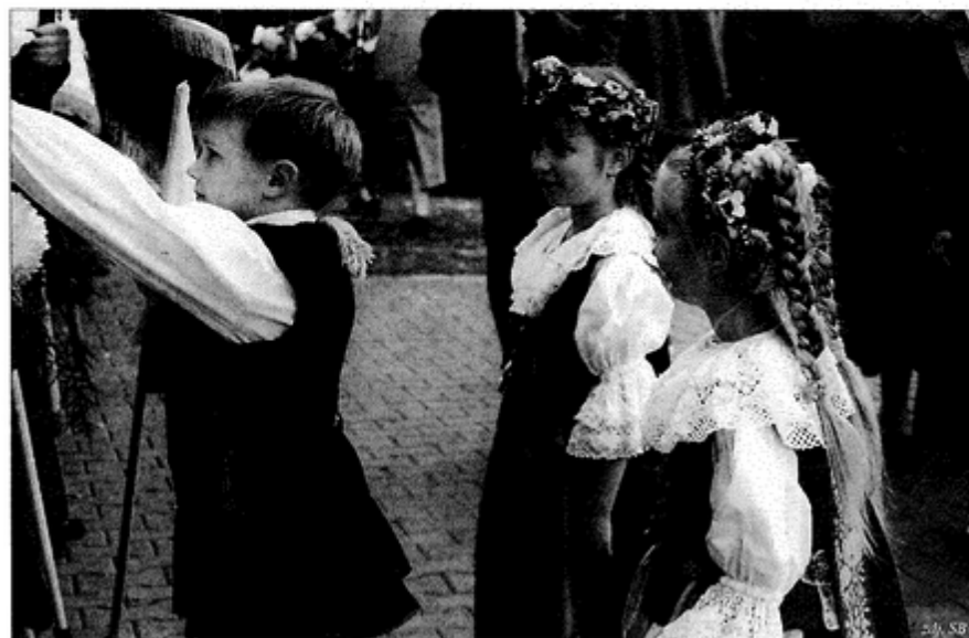
O wielkiej postaci tej ziemi pamiętają też dzieci

Gawędę historyczno-literacką o Karolu Miarce w zastępstwie dyrektora Biblioteki