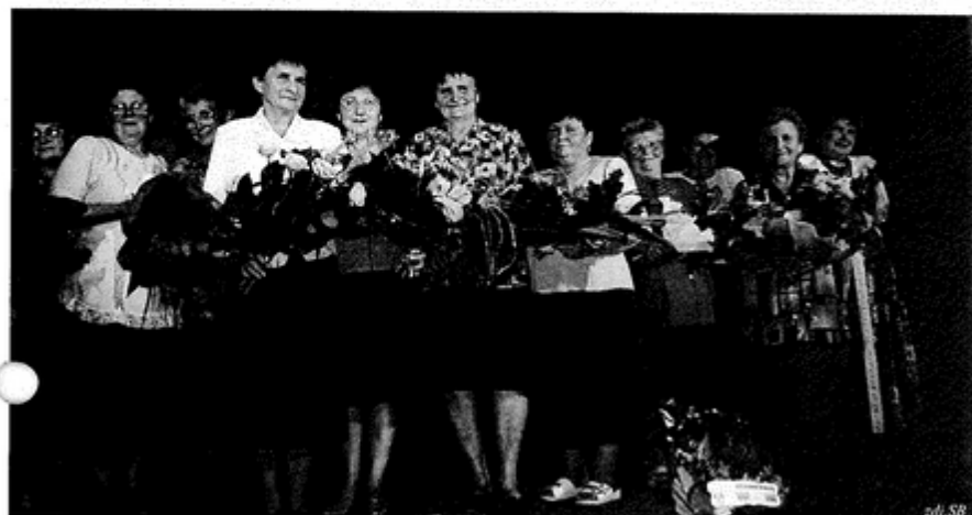
To te panie zajmują się przygotowaniem smacznych posiłków na spotkania organizowane przez KGW