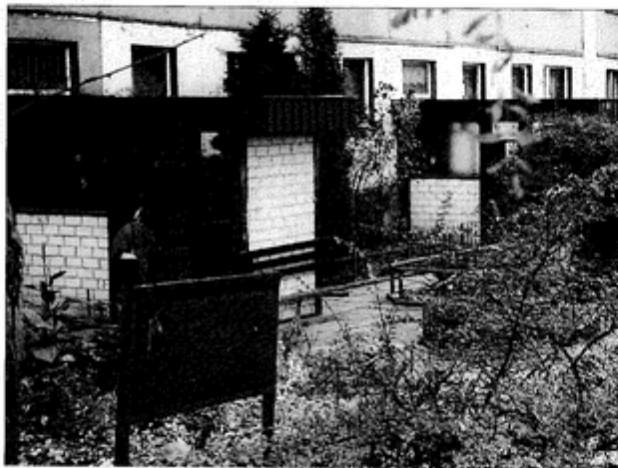
Mieszkańcy bloku przy ulicy LWP I co roku trafiają na listę nagrodzonych