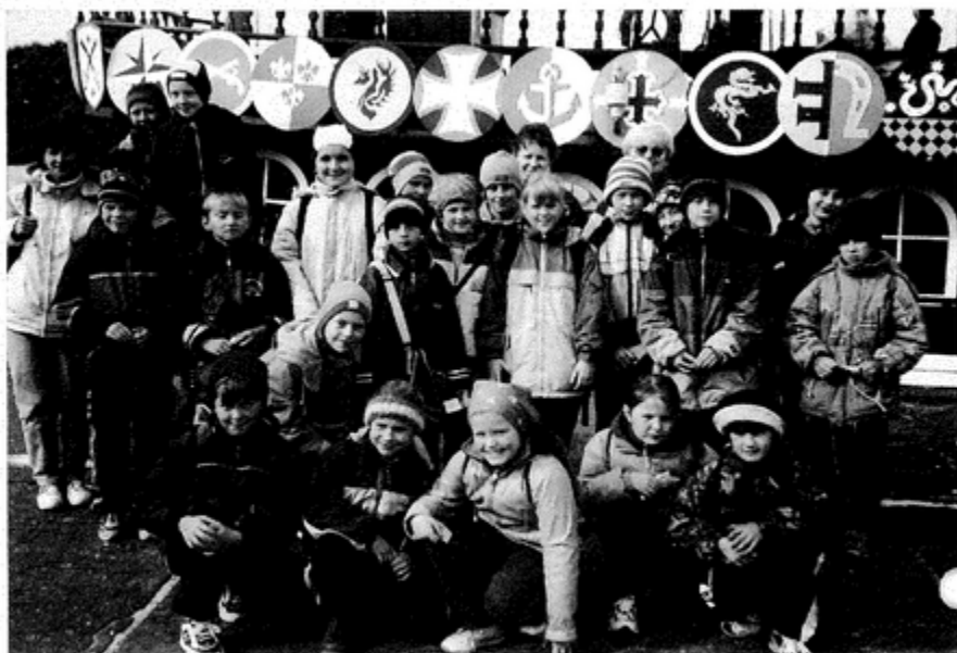
Klasa III b w porcie przed statkiem

i łabędziami nad jeziorem. Pogoda niezbyt nam sprzyjała, ale mogliśmy zobaczyć jak wygląda sztorm na morzu. Byliśmy na wielu wycieczkach np. w Gąskach zwiedzaliśmy latarnię morską, gdzie pojechaliśmy "ciuchcią". Szliśmy na spacer brzegiem morza do Mielna i na Kanał Jamneński. W Kołobrzegu zwiedzaliśmy i podziwialiśmy zabytkową katedrę, Muzeum Oręża Polskiego, płynęliśmy statkiem po morzu. Była również długa wycieczka na wyspę Wolin. Po drodze byliśmy w Trzęsaczu. Widzieliśmy też największe pole golfowe w Polsce. Zatrzymaliśmy się w Wolińskim Parku Narodowym, zobaczyliśmy tam rezerwat żubrów i orla bielika. W Międzyzdrojach przykładaliśmy nasze dłonie do odcisków słynnych gwiazd, zwiedzaliśmy Gabinet Figur Wosko-