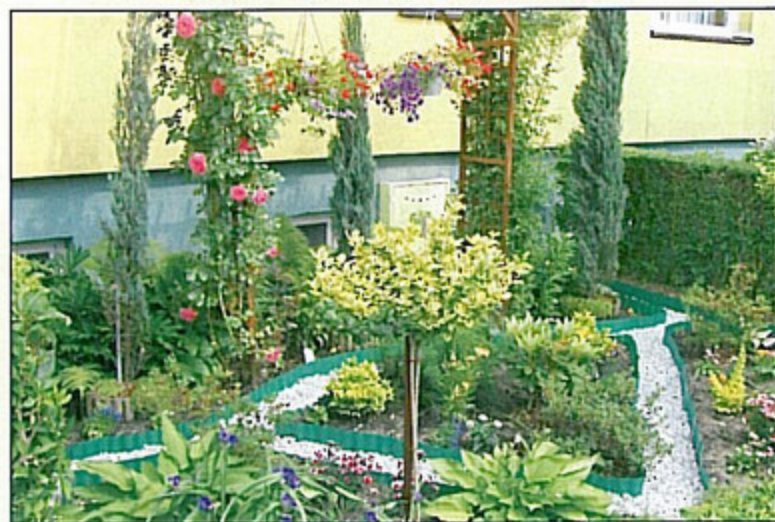
Ciekawie zaaranżowana zielen to dzieło Mariusza Kowalskiego z Górniczej 1.