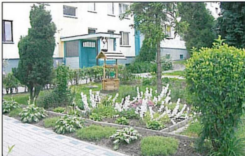
Studnia z bocianem przy ul. Górniczej 7 (Malgorzata Sachs i Elżbieta Worek).